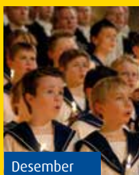
Desember Julekonsert med sølvguttene