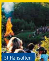
St.Hansaften Familiefest på Holmendammen