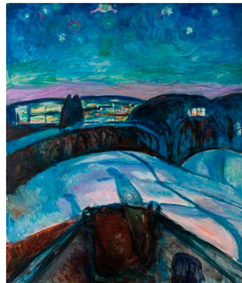
Edvard Munchs "Stjernenatt" (1922-24) fra boken "GLIMT" Olje på lerret, 80 x 65 cm. Munch-museet MM M 00187.