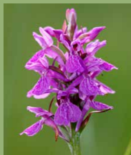
Skogmarihånd fra Slåttemyra

PS. Hvis du kan tenke deg å være med i grønn gruppe (fast eller assosiert medlem) ta kontakt med diakon Kari (ko233@kirken.no)