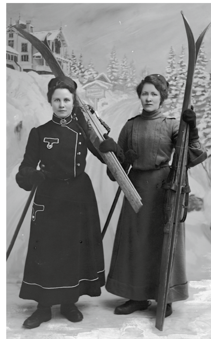
Til venstre: Studiobilde av 2 skiløpere tatt i L. Szacinski's fotostudio i Christiania. Her er Wilhelmshøi malt på et bakgrunnsteppes i atelieret. Hos anerkjente og flinke fotografer var det vanlig å ha et utvalg av bakgrunnstepper – og da gjerne av kjente og kjære motiver som Wilhelmshøi.