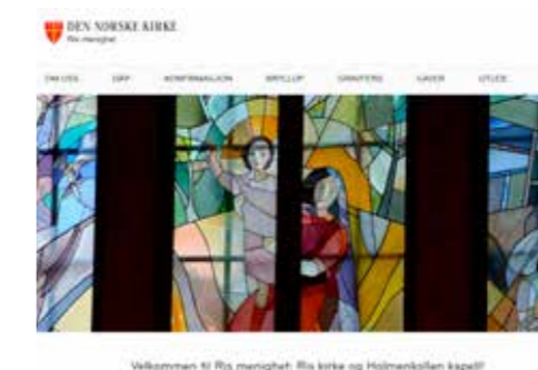
Vakkert i Ris menighet: Ris kirke og Holmenkollen kapell