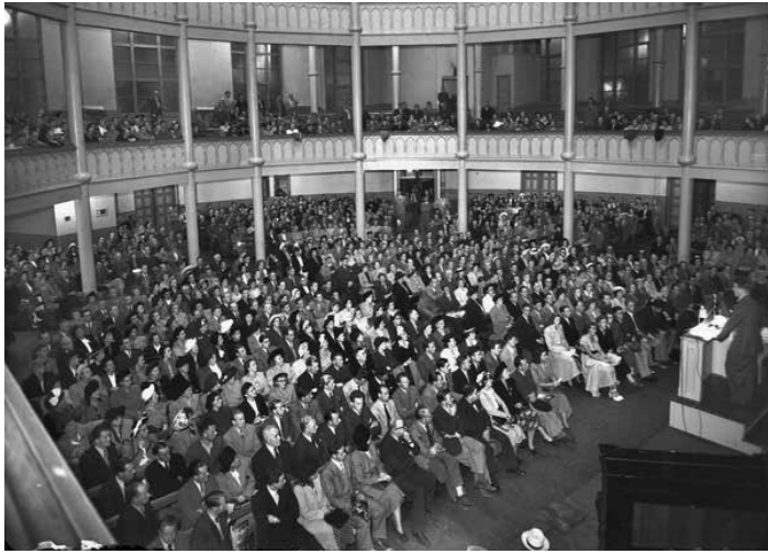
Calmeyergatens misjonshus med plass til 5000. I sin tid skandinavias største forsamlingshus.