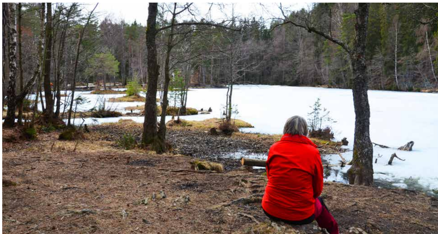
Mange har et forhold til Båntjern, og opplever stedet som unikt, uten helt å kunne sette ord på det. Den kjente arkitekten Christian Norberg-Schulz gjorde et forsøk. Det er stedet hvor vi opplever at vi er fremme.

Hvor søkt er det å sammenlikne Båntjern med Michelangelos arbeid-