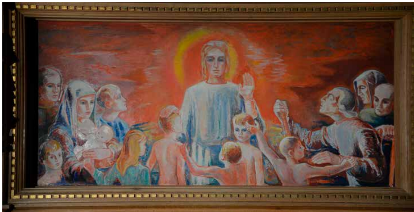
Altertavlen i Ris kirke, malt av Hugo Lous Mohr