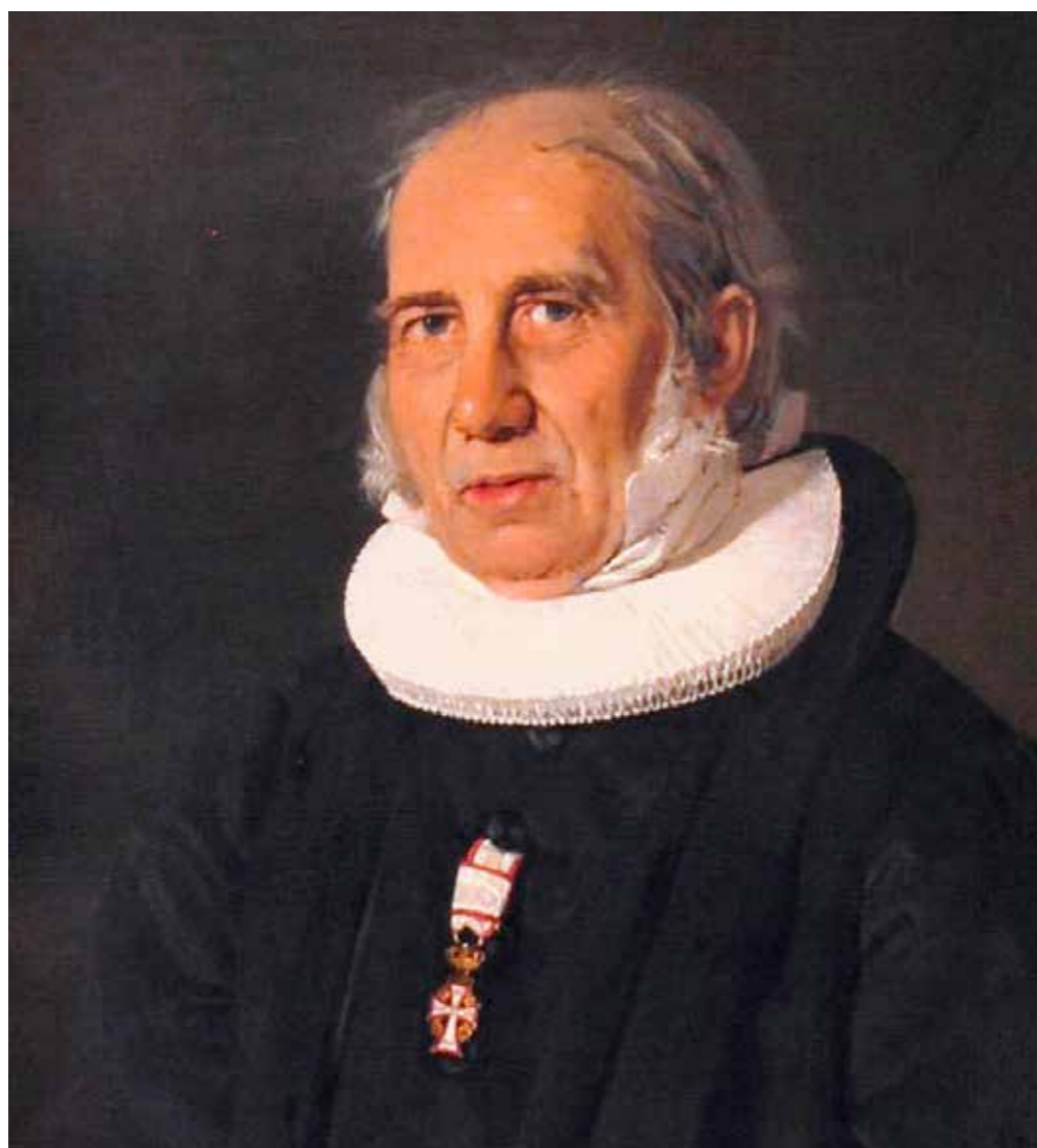
Den danske prest, forfatter, filosof, historiker, salmedikter, folkeopplyser og politiker Nikolaj Frederik Severin Grundtvig. Maleri av Christian Albrecht Jensen.

Som teolog framhevet Grundtvig sammenhengen mellom det menneskelige og det kristne. Mens den pietistiske bevegelsen hadde en «ren» menighet som sitt ideal, var Grundtvigs visjon en bred folkekirke. Han mente at ethvert folk måtte bli seg sin egen, historisk betingete identitet bevisst, og viste en stor interesse for den gamle, norrøne mytologien. Som pedagog var han kritisk til samtidens