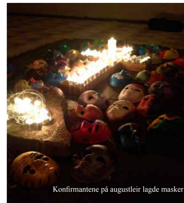
Konfirmantene på augustleir lagde masker

To av dagene var det heldagsaktivitet, da fikk konfirmantene være med på alt fra «Hele TT baker» til «Futsal» og «Kano på Mjøsa».