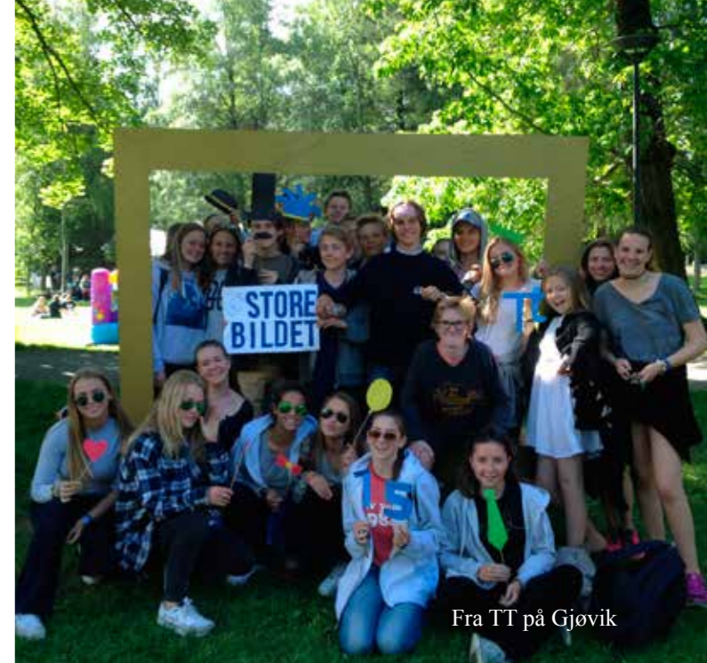
Fra TT på Gjøvik

27 konfirmanter var i år ikke med til Lia, men reise på TT, KFUK-KFUM sin sommerleir for tenåringer. De har opplegg tilrettelagt spesielt for konfirmanter også. Sammen var vi med på store morgen og kvelds-show med mening i fjellhallen på Gjøvik, vi hadde refleksjonsgrupper morgen og kveld på skolen vi bodde på, og vi var med på aktivitetene som var på torget.