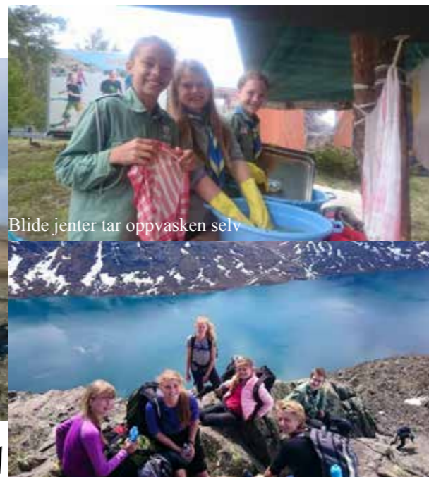
Blide jenter tar oppvasken selv