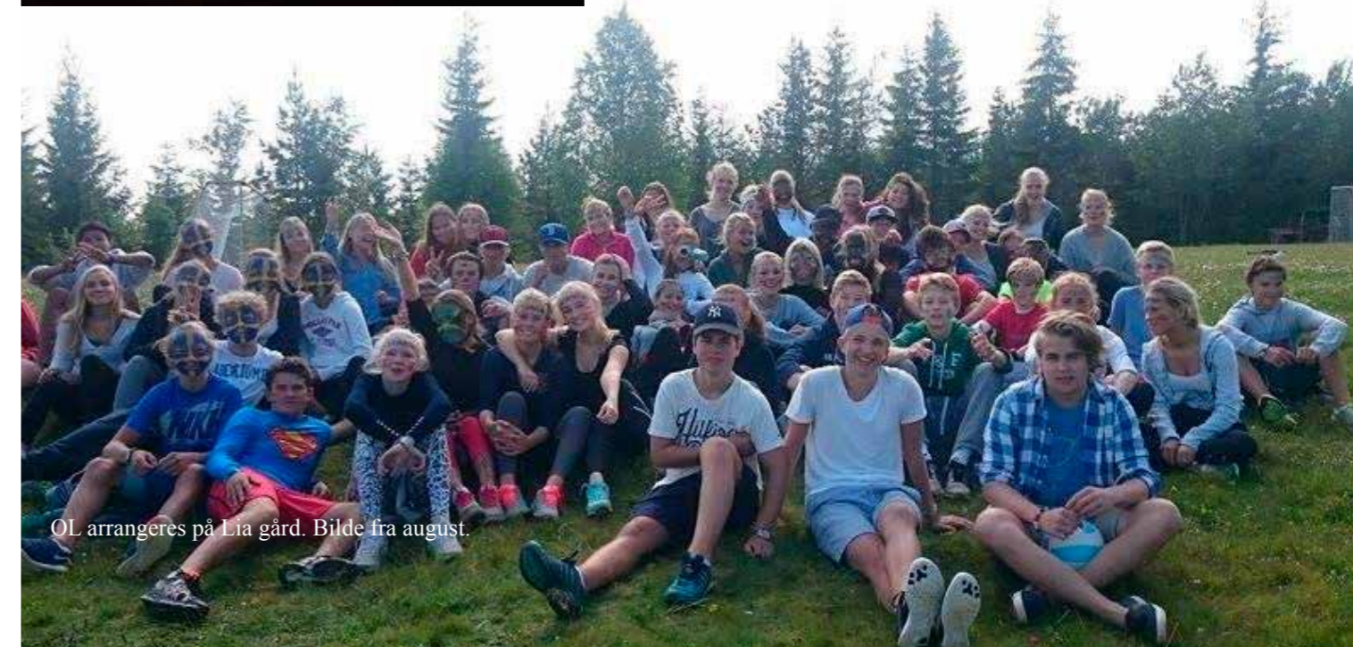
OL arrangeres på Lia gård. Bilde fra august.

Alle konfirmantene i år har fått hver sin Kristuskrans. Et lite armbånd med 18 perler. Perlene symboliserer Jesu liv og gjerning, men skildrer også livet vårt. Hver og en av oss legger ulike sider ved livet inn i perlene. Et personlig armbånd der vi har knyttet til konfirmantundervisningen.