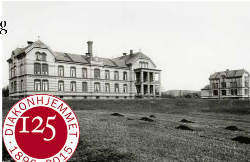
1903 Nye Diakonhjemmet Sykehus

«En diakonal salmebok» – det har vært arbeidstittelen for jubileumsboken. Den er en samling med 52 salmer og like mange fortellinger, for hver uke gjennom året. Her står nye salmer sammen med kjente og kjære, delt inn i fire kapitler ut fra Den norske kirkes diakoni-definisjon: nestekjærlighet, 12