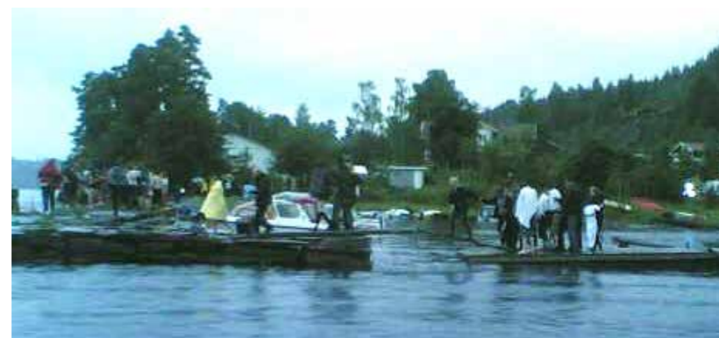
De første ungdommene er reddet inn til fastlandet

Det er kaldt. 15 grader i luft. Regn. 14 grader i vannet.