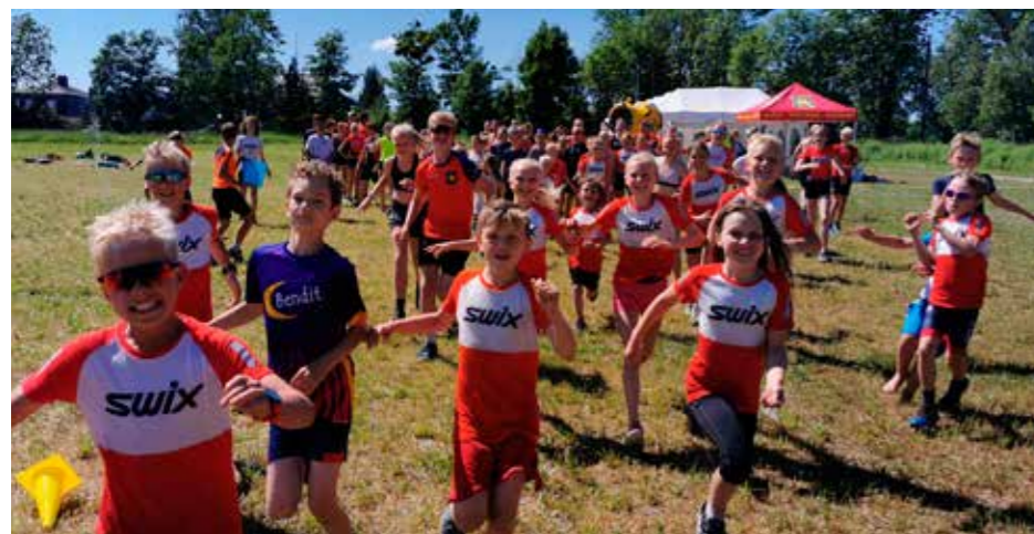
Barna på sommerskiskolen til Røa IL sprudlet og storkoste seg med alle de forskjellige aktivitetene gjennom uken. Da isbilen overraskende dukket opp på avslutningen, sto stemningen også i taket.

Røa IL er ikke bare for medlemmene. Vi har en rekke aktiviteter der alle barn kan delta. Blant disse er både Røa ILs sommerskiskole og Røa ILs Tine Fotballskole.