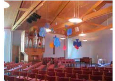
Pinsekunst fra kirken

tenke om alt liv som noe som er gitt av Gud. Ånden henger altså tett sammen med troen på Gud som skaper. Å være et åndelig menneske kan derfor være så enkelt som å se livet som en gave fra Gud og oss selv som skapt av en Gud vi kan ha en relasjon til.