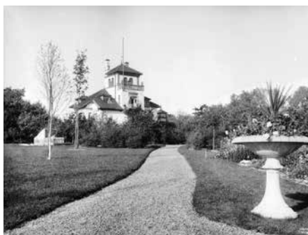
Den praktfulle villaen ved Smestaddammen: Det ble opparbeidet en storslått park rundt villaen. Interiørene var tidsriktig over-dådige, og er godt dokumentert av Wilse.