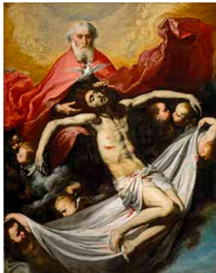
Av José de Ribera

Gud skapte i begynnelsen, og ved å fylle verden med sin ånd, oppstod livet. På denne måten er det mulig å