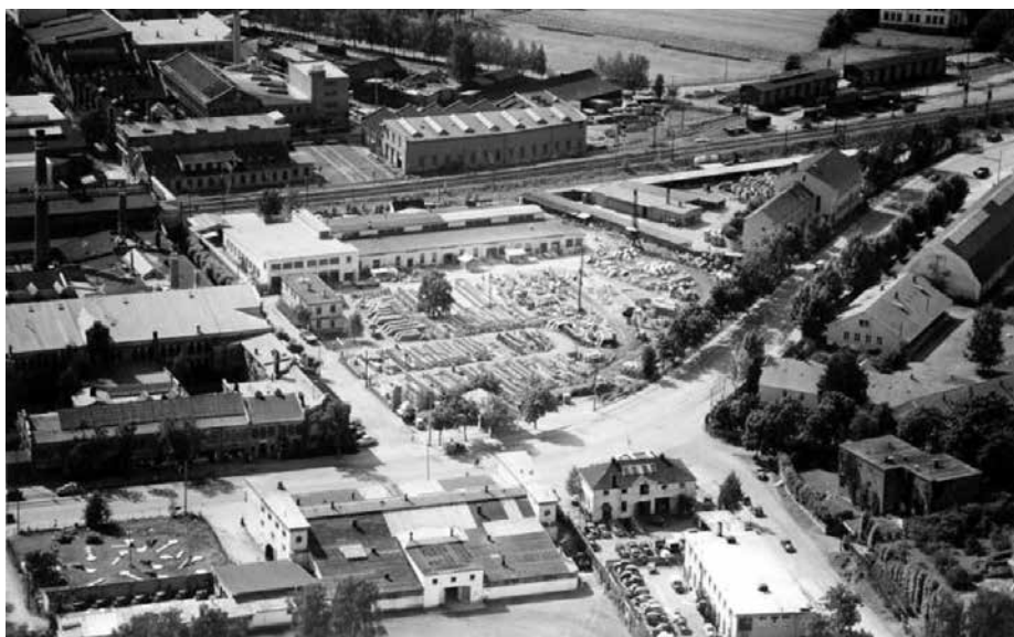
Moiner – sementvarefabrikken på Skøyen.