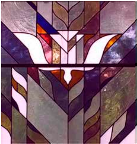
Detalj fra sidevinduet i Skøyen kirke – Ånden som en due.

Hele høsten har i kirken betegnelsen «treenighetstiden». Kirkens tro er troen på Gud som Skaper, i Jesus og som Ånd. Gud er én, men Gud kan likevel fremtre for oss på ulike måter.