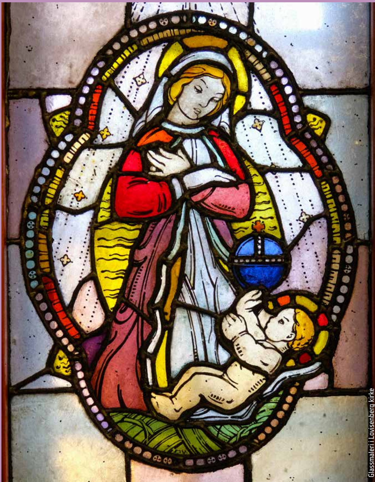
Glassmaleri i Lovisenberg kirke

For informasjon om våre arrangementer, lese søndagens preken hjemme på skjerm, se vår hjemmeside: