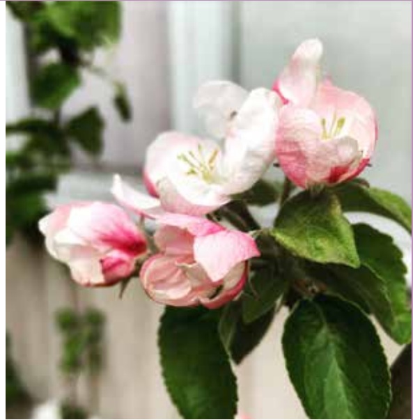
Epletrete i blomst, fra atriet ved Gamle Aker kirkesenter, Akersbakken 30.

At sitatet kunne tilskrives Luther var ikke tilfeldig. For i mange av Luthers tekster finner vi et blikk på verden som er så fullt av gudsnærvær. Gud forstås som konkret nærværende i alle ting. Det er ikke slik at Gud er i himmelen og vi er på jorden. Nei, Gud er konkret tilstede i alle ting, «nærværende i hele skapningen, i en stein, i ilden, i vannet, i et tau – for han er virkelig der...», sier Luther i 1526, når han kritiserer sine motstandere for å ikke åpne øynene så de ser Guds storhet. For Luther er alle skapninger uttrykk for Guds ord og tale – «solen, månen, himmel og jord, Peter og Paulus, jeg og