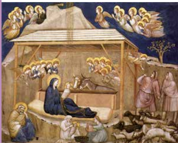
Fødselsscenen slik Giotto (1267-1337) omlag 100 år senere fremstilte den i fransiskanernes hovedkirke San Francesco i Assisi i Italia.

Nå gikk man gjennom landsbyen og inviterte alle til å komme og se julekrybben og feire gudstjeneste. Om kvelden 24. desember beveget så folkemengden seg mot hulen, som i prosesjon, med fakler og lys. Ved midnatt, kledd som diakon, talte så Frans til folket. Thomas Celano forteller fra kvelden: «Da Frans kom [til hulen], fant han en krybbe full av høy, en okse og et esel. Alle de tilstedeværende opplevde