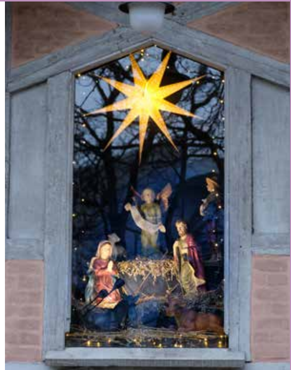
Julekrybben i stallen i Akersbakken 30, første gang satt opp julen 2020.

en ny og ubeskrivelig glede i nærvær av julescenen. ... På Greccio var det ingen statuer/dukker, fødselsscenen ble fremført og skapte en sterk opplevelse for alle som var til stede.»