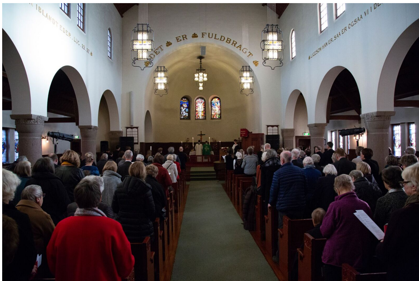
Fra festgudstjenesten i Lovisenberg kirke