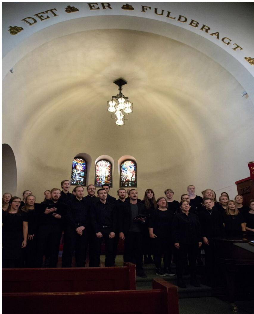
Lovisenbergkoret sang under festgudstjenesten.