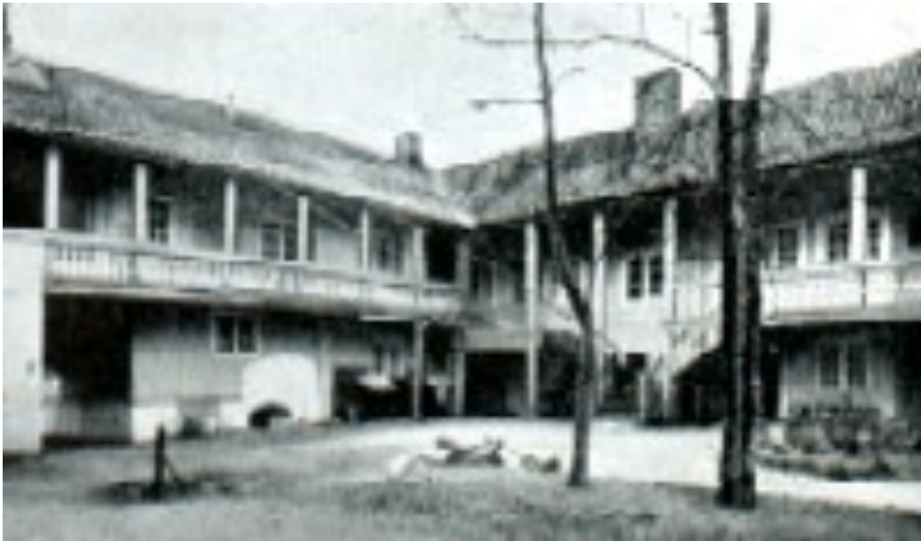
Asylet, Kommunalgaarden på Grønland i Oslo

Sykehusets fundament ble lagt av Norges første sykepleier, pioneren Cathinka Guldberg, i 1868. Hennes innsats og fremsynthet innen kompetanse og omsorg var med på å skape grunnlaget for driften frem til dagens moderne virksomhet ved sykehuset.