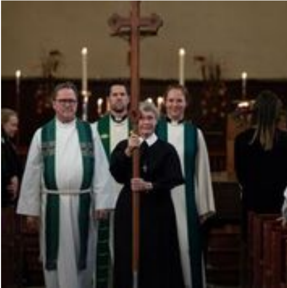
Prosesjon ved festgudstjenesten i Lovisenberg kirke