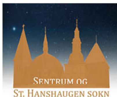
SENTRUM OG ST. HANSHAUGEN SOKN