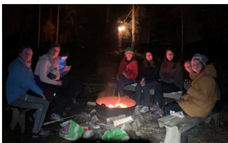
Bålkos på hyttetur