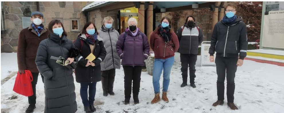
Ikke tilstede på bildet: Hanna Nydal.

MR takker staben for et godt samarbeid i året som er gått, og takker hver enkelt for helhjertet innsats i Tonsen menighet!