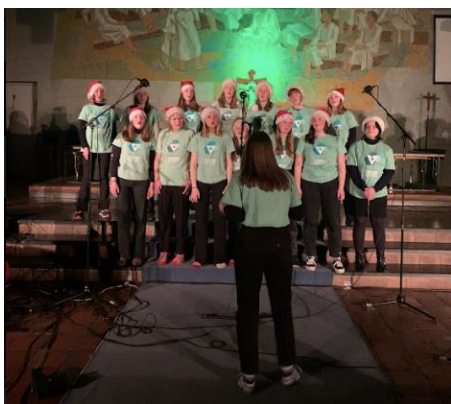
Bildet fra konserten 12.12