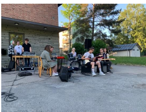
Bildet fra siste øvelse før sommeren.