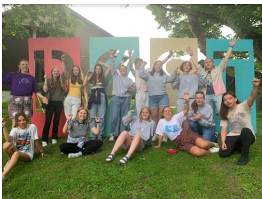
Bildet tatt på RØST sammen med de andre ungdommene som reiste fra regionen.