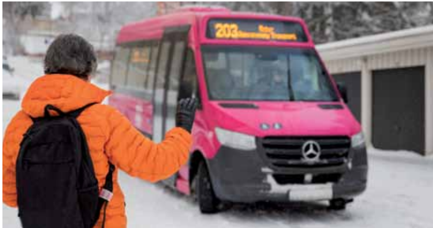
Flere bydeler tilbyr «Rosa Busser»-transport, deriblant Bjerke og Nordre Aker.