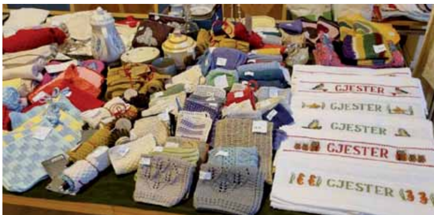
Mye flott håndarbeid å få kjøpt på Tonsenmessas 2021.