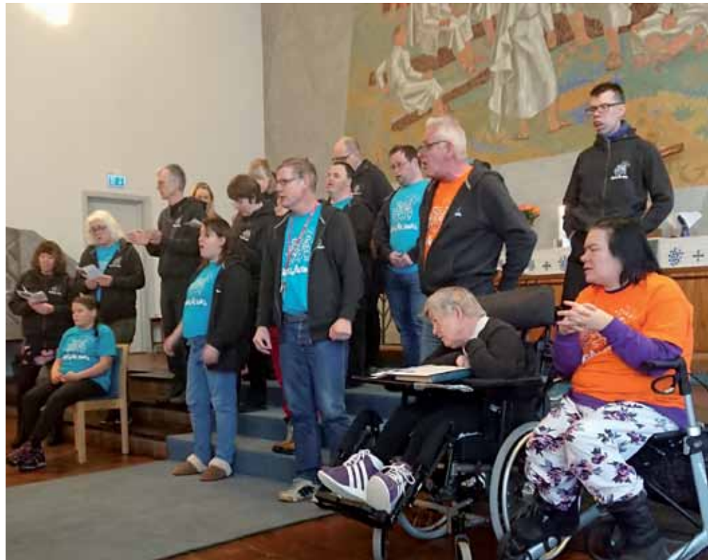
I 2019 hadde menigheten besøk av «SingAlong».

«SingAlong» er et musikkarbeid og tilbud for mennesker med utviklingshemming. De holder til i Grefsen kirke, men har medlemmer fra flere steder i Oslo. «SingAlong» gjennomfører to store prosjekter i løpet av året – julespill og påskespill – som har mange medvirkende og fremføres i Grefsen kirke.