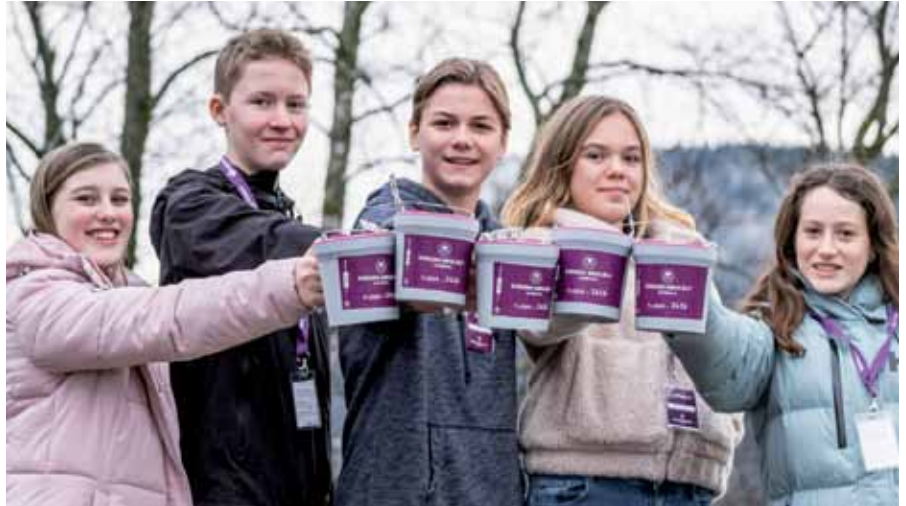
Kirkens nødhjelps fastaksjon skjer 3.-5. april 2022.