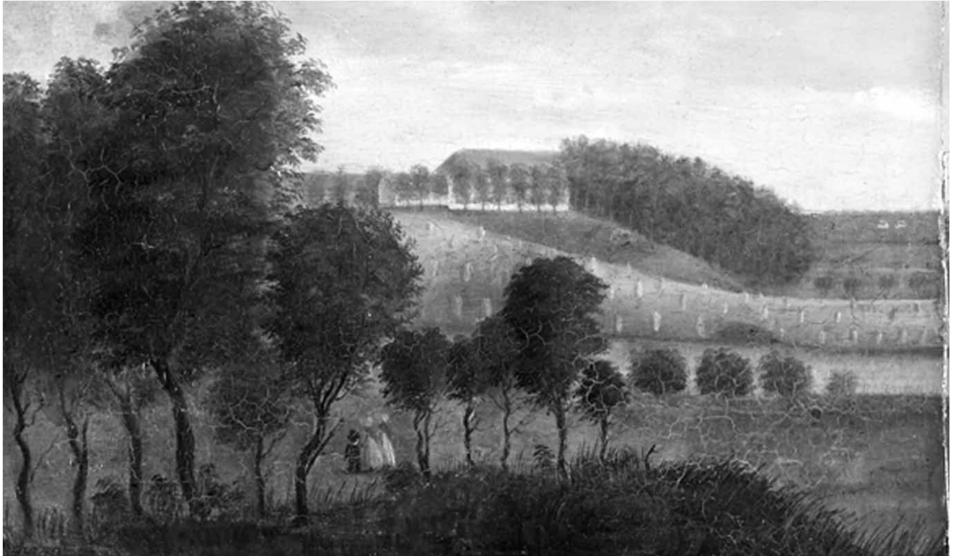
Maleri av Mathias W. Eckhoff av Økern hovedgård fra 1821. Det er i Oslo Museums eie. Maleren har stått på knausen ovenfor Løren skole. Sletten i forgrunn ble 140 år senere Økern Torg.