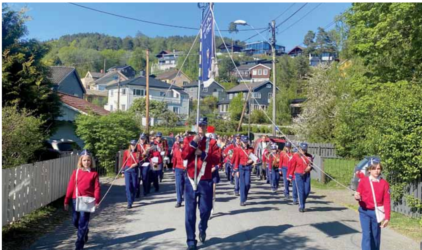
Årvoll skoles musikkorps spiller i nærmiljøet på Årvoll.

alle musikantene. Opp gjennom årene har Årvoll skoles musikkorps besøkt 11 ulike land.