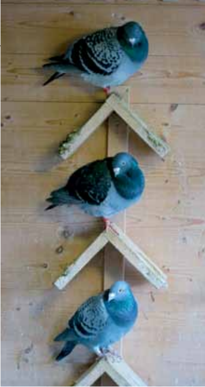
Brevduer i dueslaget