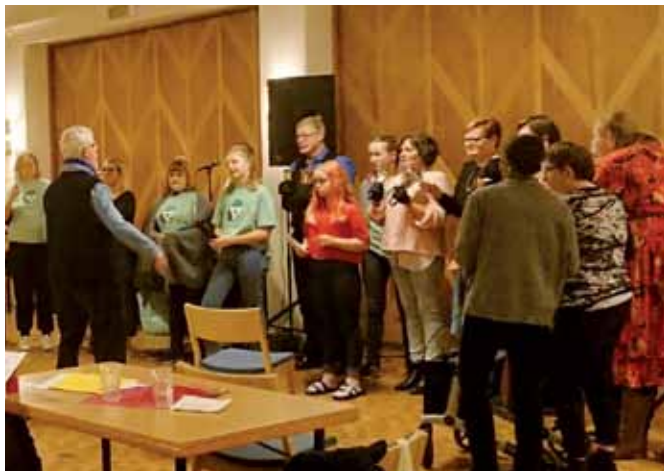
Fra «Musikk og Mat» 2018.