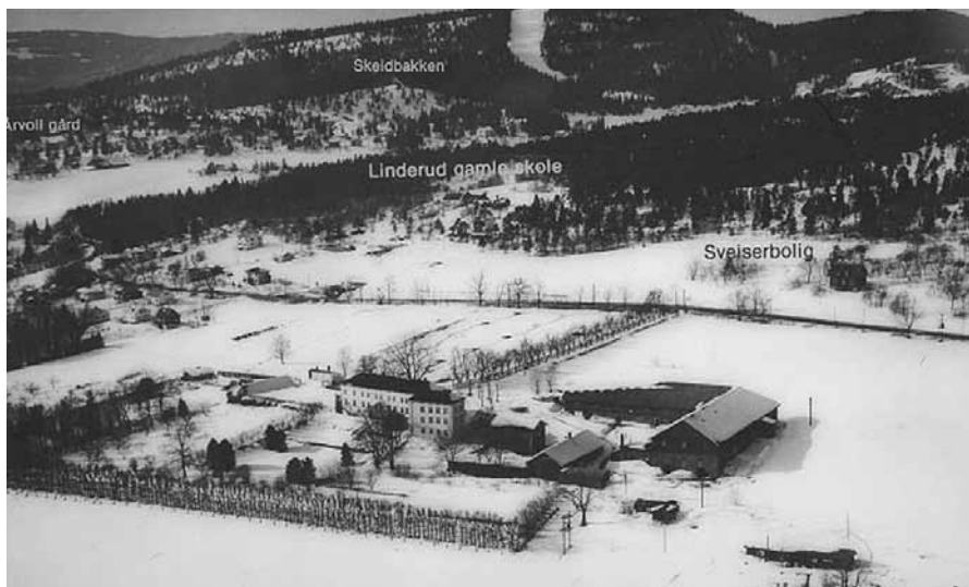
Oversiktsbilde fra 1951. Fotografiet finnes i Groruddalens historielags billedatabase.

Skolehverdagen kunne være hard. Det var eksamen med karakterer hvert år. Strøk du, måtte gå om igjen. Men den dagen du fylte 15 år, var skolegangen slutt. Læreren hadde lov til å bruke fysiske avstraffelser mot skulk, forsentkomming, dovenskap, obsternasighet, manglende lekselesing og uro i timene. Slag med pekestokken (spanskrøret) skulle protokollføres og