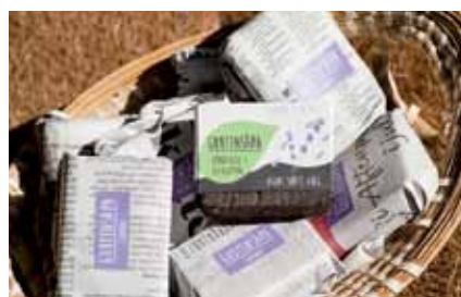
Noen av Grutens produkter

møysommelig prosess der hun bl.a. må sikre at gruten er fri for skadelige stoffer som muggsporer, kan hun tilsette sporer av østerssopp i kaffe-gruten og en tid senere høste østerssopp til salg. Hittil ligger produksjonen på i overkant av 800 kilo sopp per måned, og etterspørselen er allerede større enn produksjonskapasiteten.