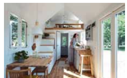
Slik ser mikrohusene ut inni

Andre virksomheter på Vollebekk fabrikker har navn som Resirqel og Omattatt og gir et tydelig signal om at gjenbruk er i fokus. Eksempler på andre virksomheter med kreative navn er Mora Di; de driver med sykkel-reparasjoner, og Relove som jobber med redesign, reparasjon og gjenbruk