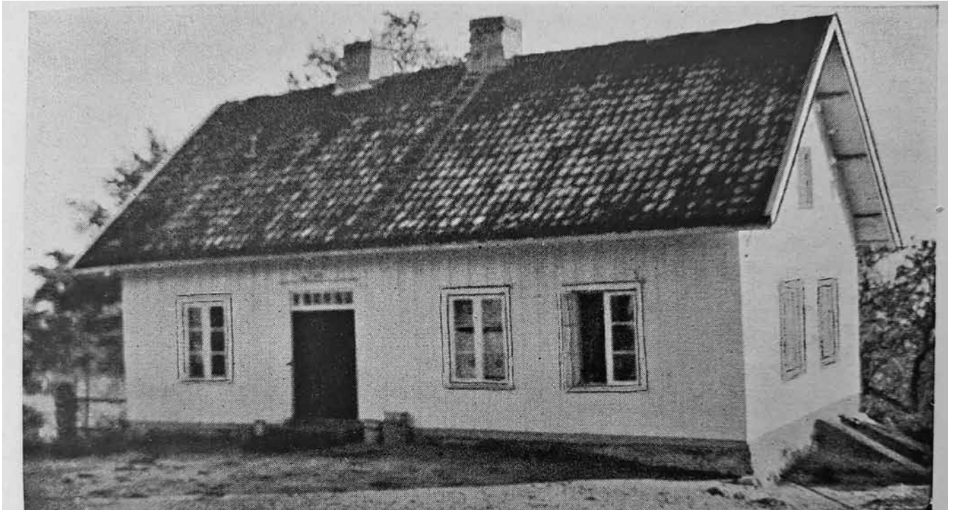
Linderud gamle skole, avfotografert fra bokverket om Aker kommunes historie.

I lia opp mot Tonsenhagen, der du finner Sandbakken barnehage i dag, lå den opprinnelige Linderud skole. Den var sammen med Rommen skole den eldste i Groruddalen. Rommen er bevart, men gamleskolen på Linderud er borte. Men den underlige historien om denne skolen fortjener å bli fortalt.