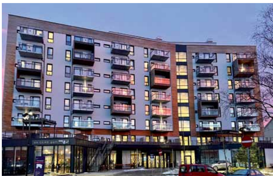
Årvoll omsorgssenter en vinterdag.

Facebook: «Årvoll omsorgssenter» og «Senior i Bjerke». Se også annonse om seniortilbudet i Groruddalen Akers Avis eller sjekk ut Helseveiviser til deg over 60 år, digital veiviser for forebyggende helsetjenester https://www.oslo.kommune.no/helseveiviser