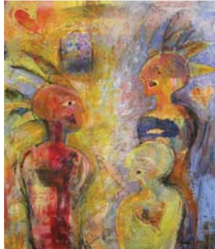
Bildets motiv: Universelt språk

Det er lett å kjenne igjen Grete Marsteins kunst, enten hun lager grafikk eller maler bilder. Både fargene hun bruker, og motivene: Mennesker og natur. Menneskene i bildene hennes er sterkt forenklet, ikke individuelle. Hun er opptatt av det urbane livet,