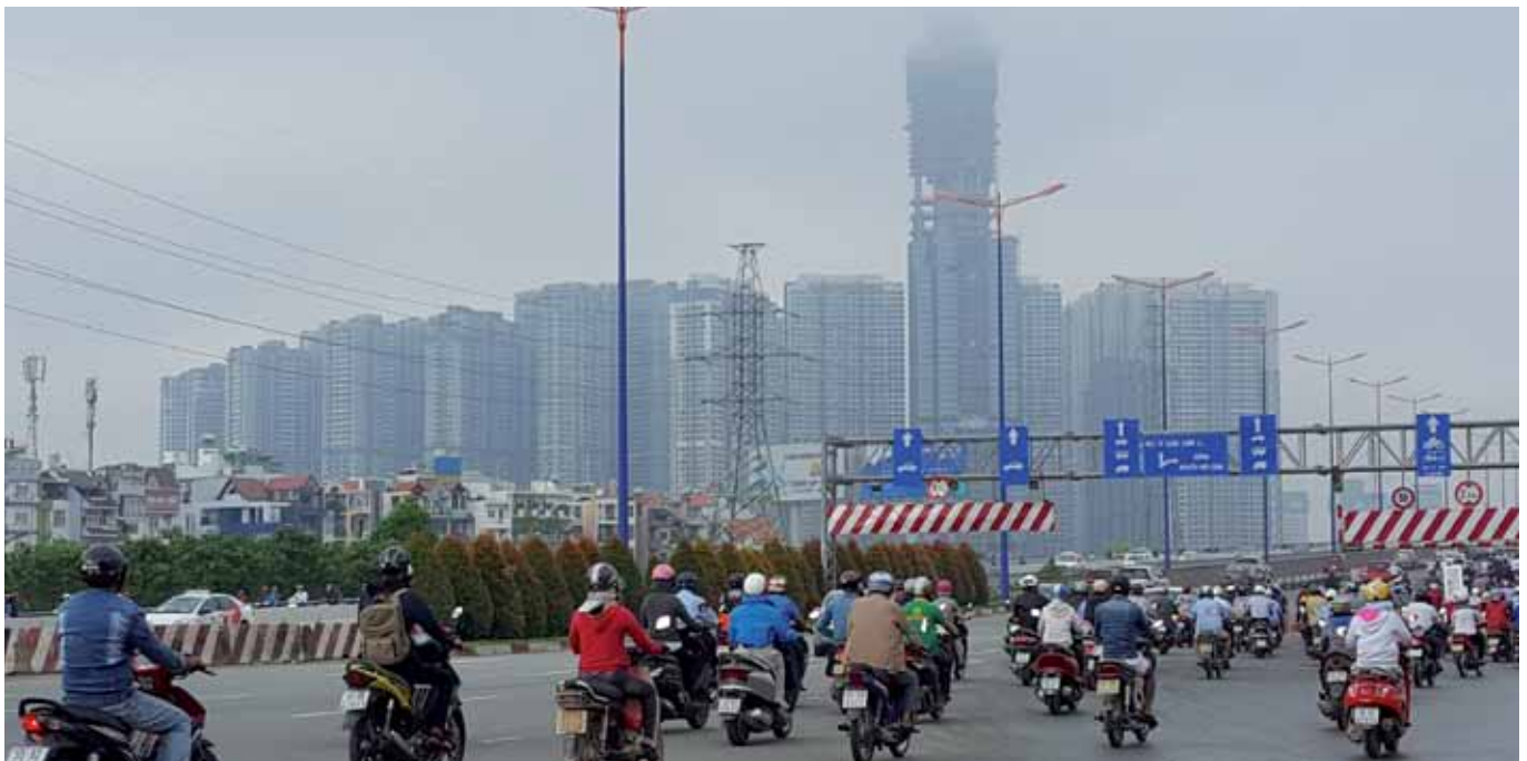
På vei til jobben. Ho Chi Minh har mer enn 8 millioner innbyggere og får stadig flere og større gigantiske boligblokker.

en mye høyere prosent enn for resten av befolkningen i Vietnam.