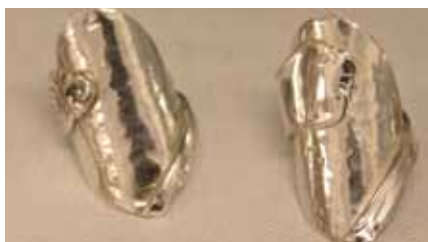
Englesmykke (til høyre) og ringer laget av teskjeer (til venstre).

ulike varianter, og også hund og katt er representert. Noen ganger er naturinspirasjonen mer indirekte. Det kan være en spesiell form som inspirerer og legger grunnlag for et nytt uttrykk.