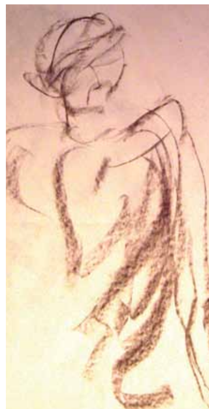
Utsnitt fra et maleri av Mari Wirgenes

Gud ønsker seg barmhjertighet slik han selv er barmhjertig. Fastetiden er en god anledning til å gjøre nestekjær-