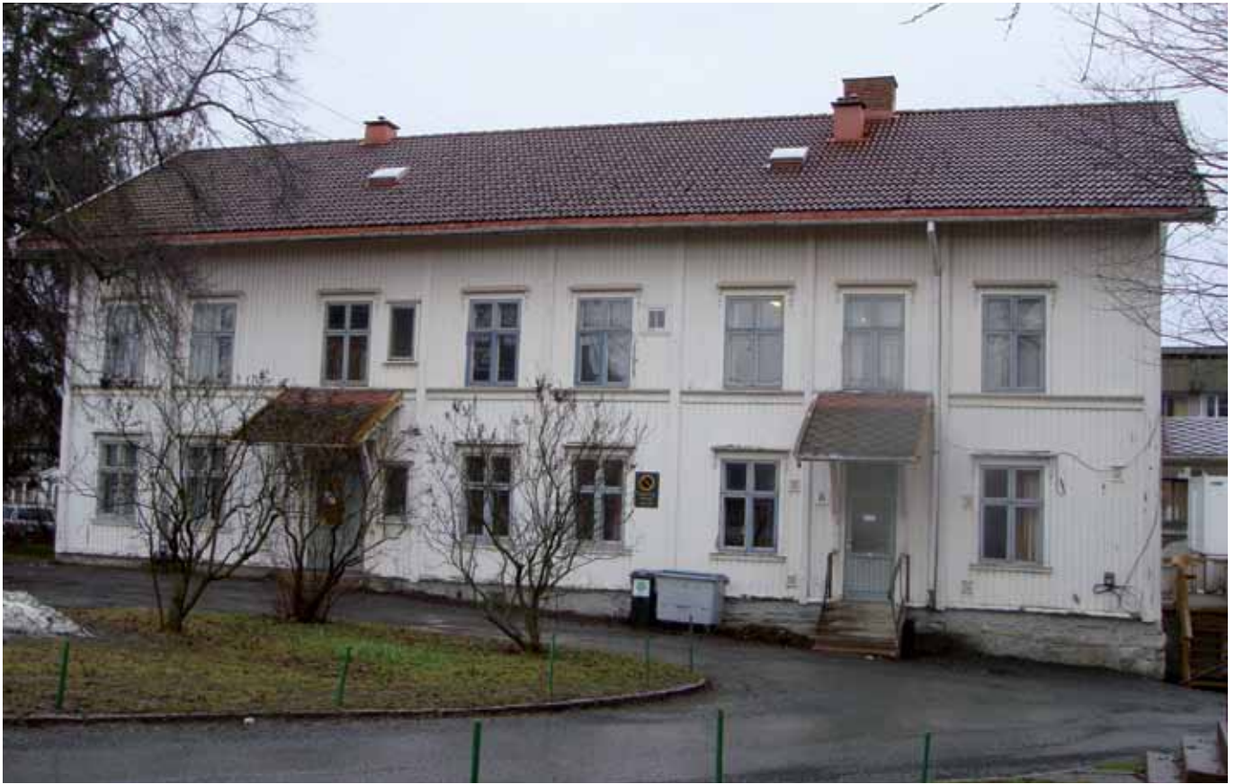
Fattiggården fotografert av Anne Fikkan i 2009

Du har sikkert gått forbi den store, hvite «sveitservillaen» inne på Aker sykehus og lurt på hva det litt slitne huset har der å gjøre. Dette er den gamle fattiganstalten; stedet der de nederste på den sosiale rangstigen ble plassert. Den var i bruk fra 1887 til 1919.