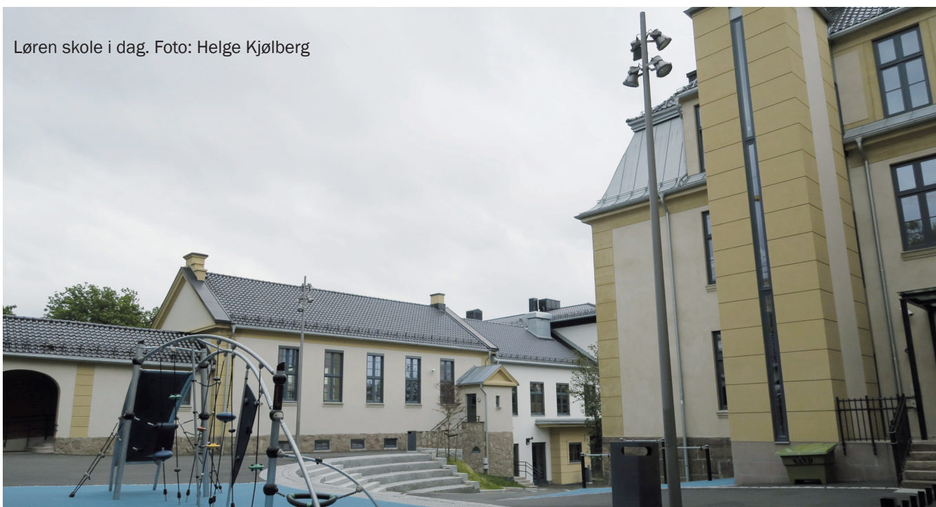
Løren skole i dag.

Foreningen slekt og data: Gravminner i Norge Graf, Maria: Løren skole 1891 - 1966, Oslo 1996 Oslo byarkiv, protokoller fra Løren skole.