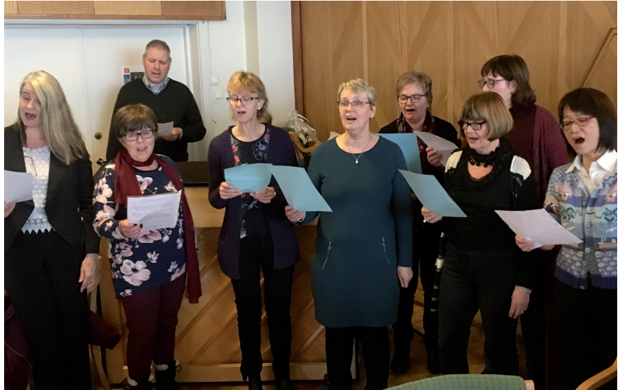
Tonsen kammerkor er et fellesskap hvor vi trives i lag og skaper god musikk.

Kammerkoret har en konsert i Tonsen Kirke i slutten av hvert semester. I tillegg bidrar koret med musikal-