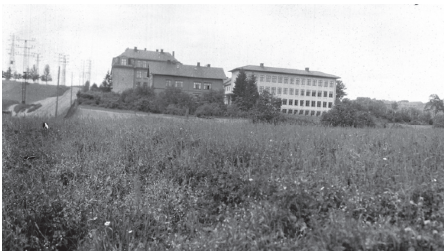
Bilde 2: Skoleanlegget slik det så ut ca. 1940. Den første murbygningen (bak) kom i 1910, og ble bygget på i 1918. Det hvite nybygget sto ferdig i 1925. Den videre veksten i elevtallet ble dekket ved nye skolebygg: Sinsen, Årvoll, Hasle, Tonsenhagen, Linderud, Refstad, Vollebekk og Tegilverket. Lærerens åkerland i forgrunnen ble senere skolehage, og gir nå plass til en ny skolebygning.

med menn som har arbeidsklasseyrker eller er arbeidsledige. En av jentene finner vi i en trang leilighet på Bjølsen, gift med en tomtearbeider, men med to fattiglemmer og et fosterbarn for å spe på inntekten, i tillegg til sin egen ett-åring.