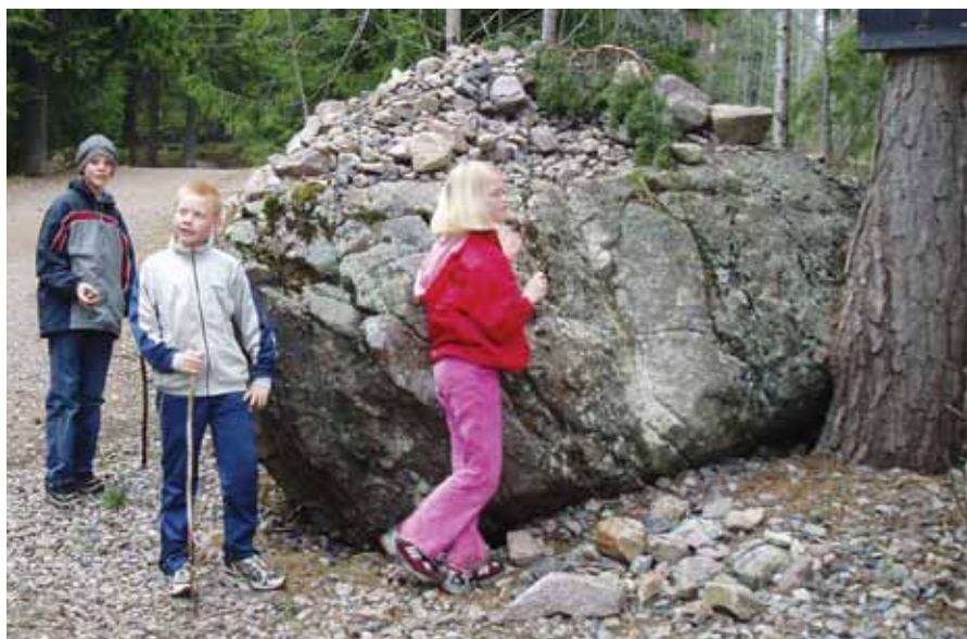
En stopp ved kastesteinen.

Går du til fots, er det fine små stier østover langs høydedragene av Linderudseterhøyden. Dreier du etter hvert sørøver, kan du komme tilbake til Årvoll via Storhaug. Her er nydelig natur hvor det bare er å ta seg fram på måfå.