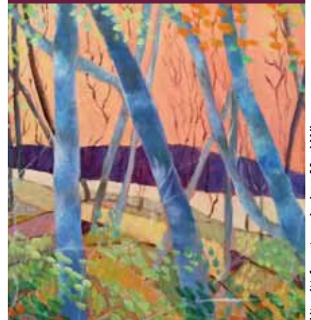
Utsnitt fra et maleri av Mari Wirgenes