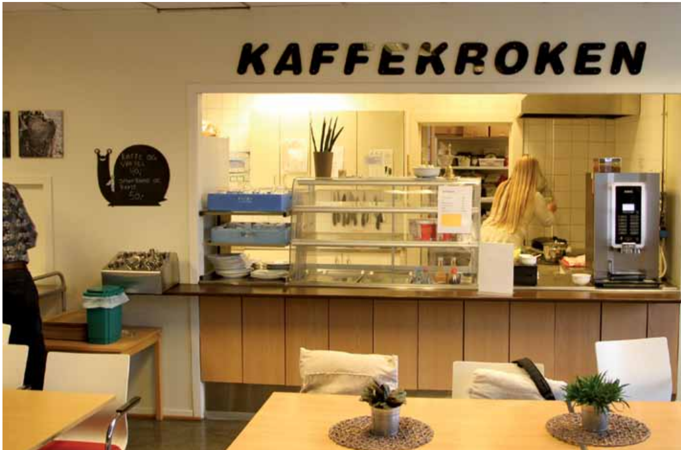
På nærmiljøsentret er det en hyggelig kafé hvor det blant annet serveres velsmakende, nystekte vaffler