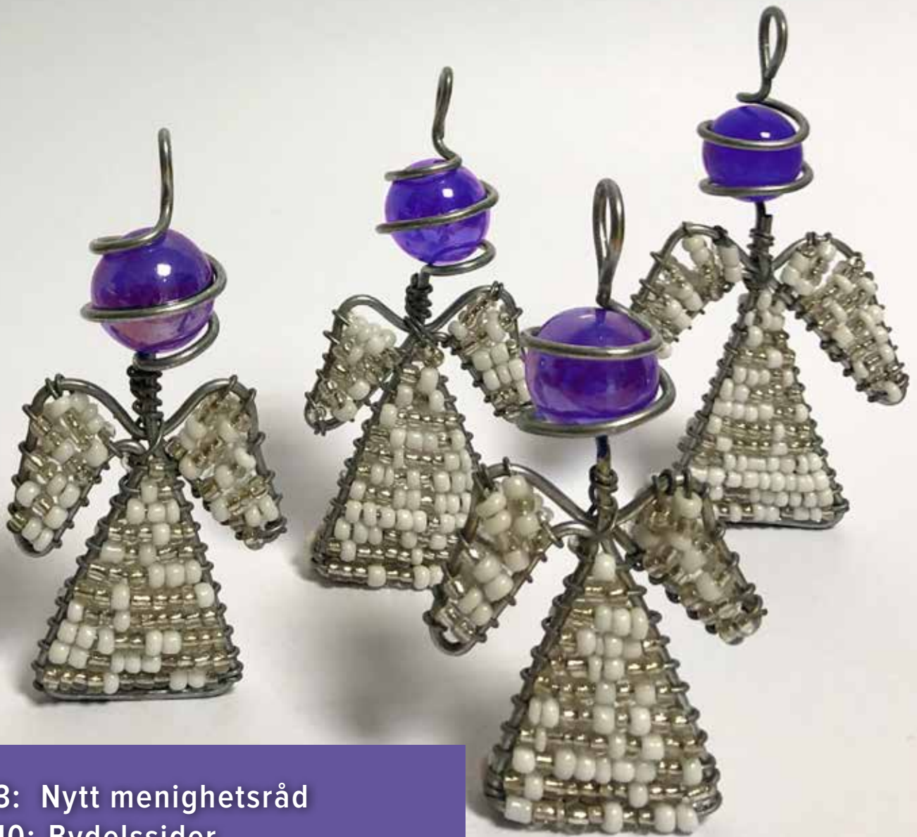
Foto : Petter N. Dille. Engler produsert for Ullern i vennskapsmenigheten Ntuzuma i Sør-Afrika.