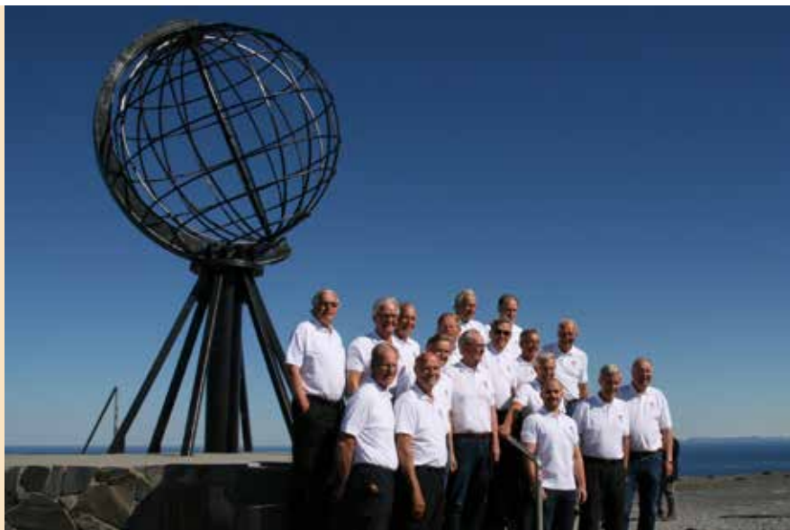
Fra korets Nord-Norge tur i 2017 – MMI på Nordkapp