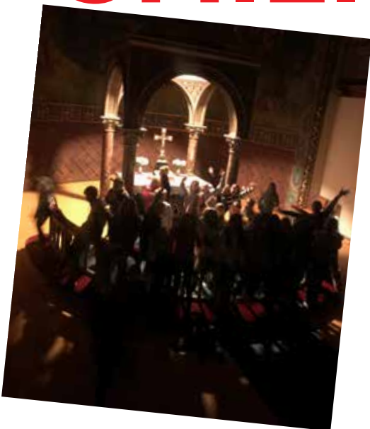
Mørkegjemsel i kirken