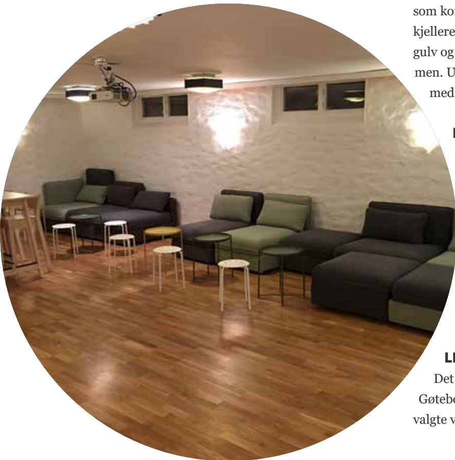
Nyoppussede lokaler i kjelleren for både ungdommer og andre

Det har vært en tradisjon i Ullern å invitere til ledertur til Gøteborg. Men på grunn av sykemeldinger og færre i stab, valgte vi å droppe dette i 2017.