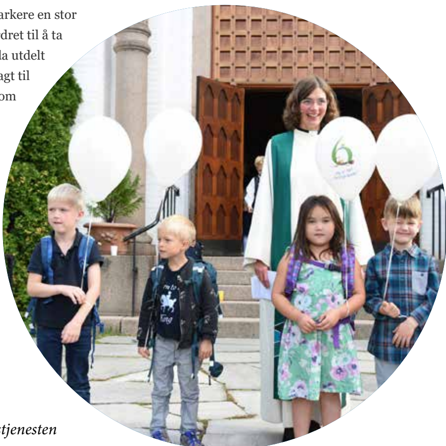
Stolte 6-åringer utenfor kirken etter gudstjenesten

Det var i år 32 fornøyde 11-åringer som deltok på året Lys Våken (mot hele 65 stk i 2016). Deltakerantallet har jevnt steget de siste årene, og har de siste årene ligget på rundt 30 påmeldte – med unntak av i fjor der antallet doblet seg. Dette er gledelig. Vi tror vi gjennom de siste årene har klart å bygge opp tiltaket, og skape et godt rykte. Ulike ungdomsledere var engasjert i både planlegging og gjennomføring av arrangementet. Nytt av året er at vi startet arrangementet sammen med adventsaksjonen, til stor stemning for barna. Her deltok de på adventsverksted ledet av dyktige frivillige, før arrangementet fortsatte i kirken. Etter overnatting i selve kirkerommet (med våkne vakter til stede gjennom hele natten) våknet vi opp til 1. søndag i advent, der vi feiret gudstjeneste sammen. Alle 11-åringene var med på gudstjenesten med både utforming og medvirkning, noe som var en flott opplevelse.