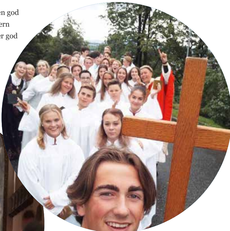
Et flott konfirmantkull også i 2017