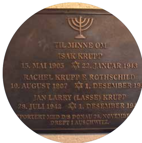
Minneplakett i våpenhuset

sert-turneene la turen innom Ullern kirke i år, slik at det var mulig å gå på konsert i Ullern kirke mange av kveldene i adventstiden. Konsertene gir et økonomisk tilskudd til menigheten, og i tillegg får mange mennesker oppleve bydelens vakreste konsertsal.