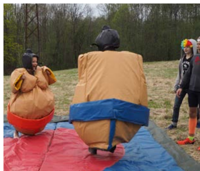
Sumo bryting på ungdomsdag.