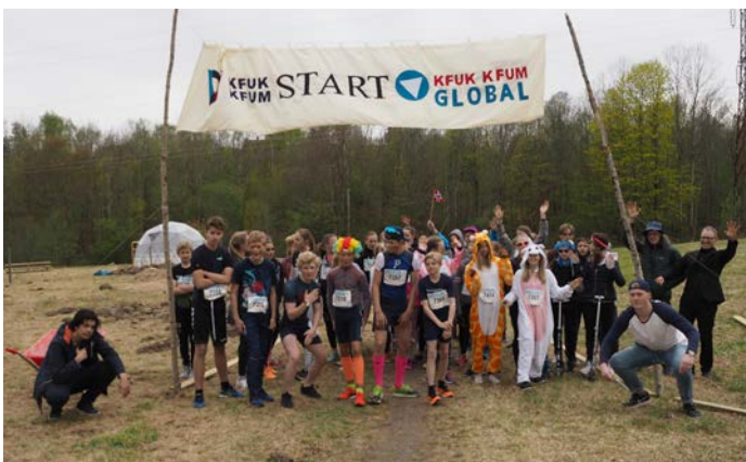
Globalløp hvor ungdommene samlet inn 16 000 kr. på ungdomsdag.