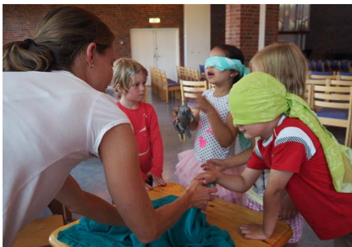
Vi prøver hvordan det er å være blind på 6-års samling.