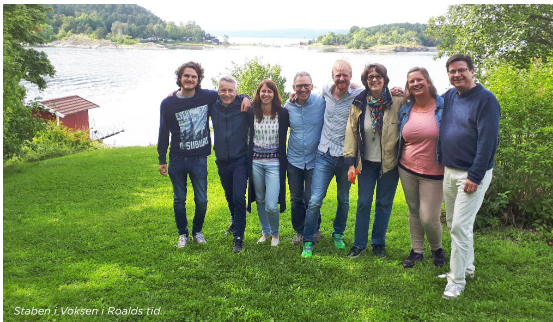
Staben i Voksen i Roalds tid.