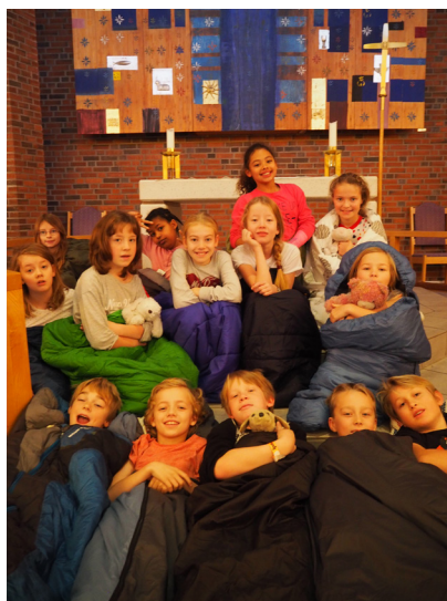
Overnatting i kirkerommet på LysVåken.