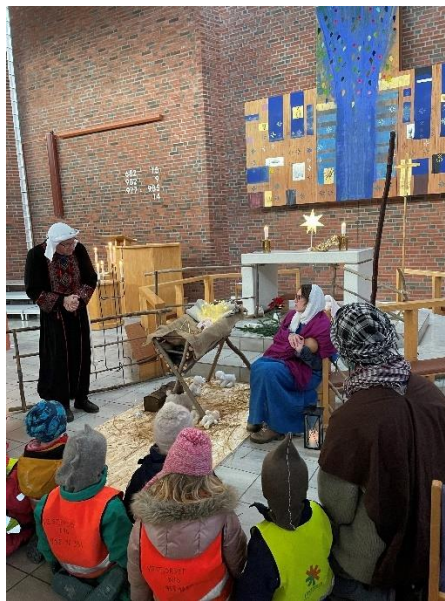
Fra en av de 15 barnehagevandringen

I Voksen kirke har vi fra tid til annen glimrende konserter som mange flere kunne hatt glede av. Det er en utfordring å nå ut med informasjon og PR om hva som skjer i kirken.