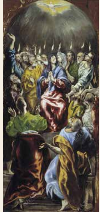
Pinse av El Greco 1600-tallet

Pinse handler om brikkene som falt på plass og gav