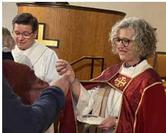
Søndag 28. april var det visitasgudstjeneste i Røa kirke for alle de tre menighetene. Biskopen holdt dagens preken og deltok under nattverden.