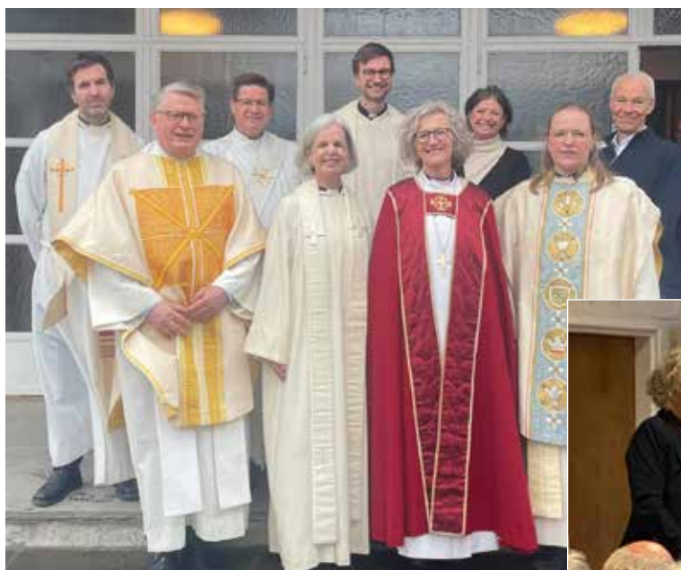
Biskopen sammen med stabene i Voksen og Røa menigheter etter visitasgudstjenesten søndag 28. april.