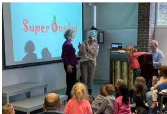
Onsdag 24. april møtte biskopen barn og voksne på supertirsdag i Voksen.