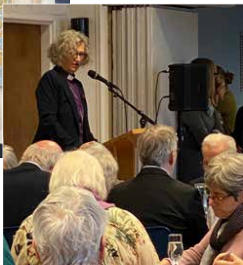
Etter visitasgudstjenesten holdt biskop Kari Veiteberg visitasforedrag der hun kom med utfordringer til menighetene.