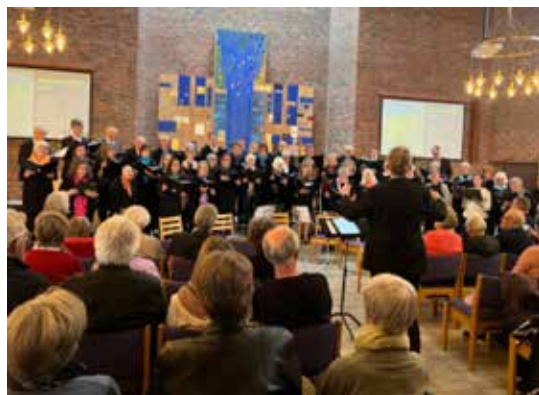
Vårkonserten i Voksen kirke onsdag 24. april var også en del av visitasprogrammet.