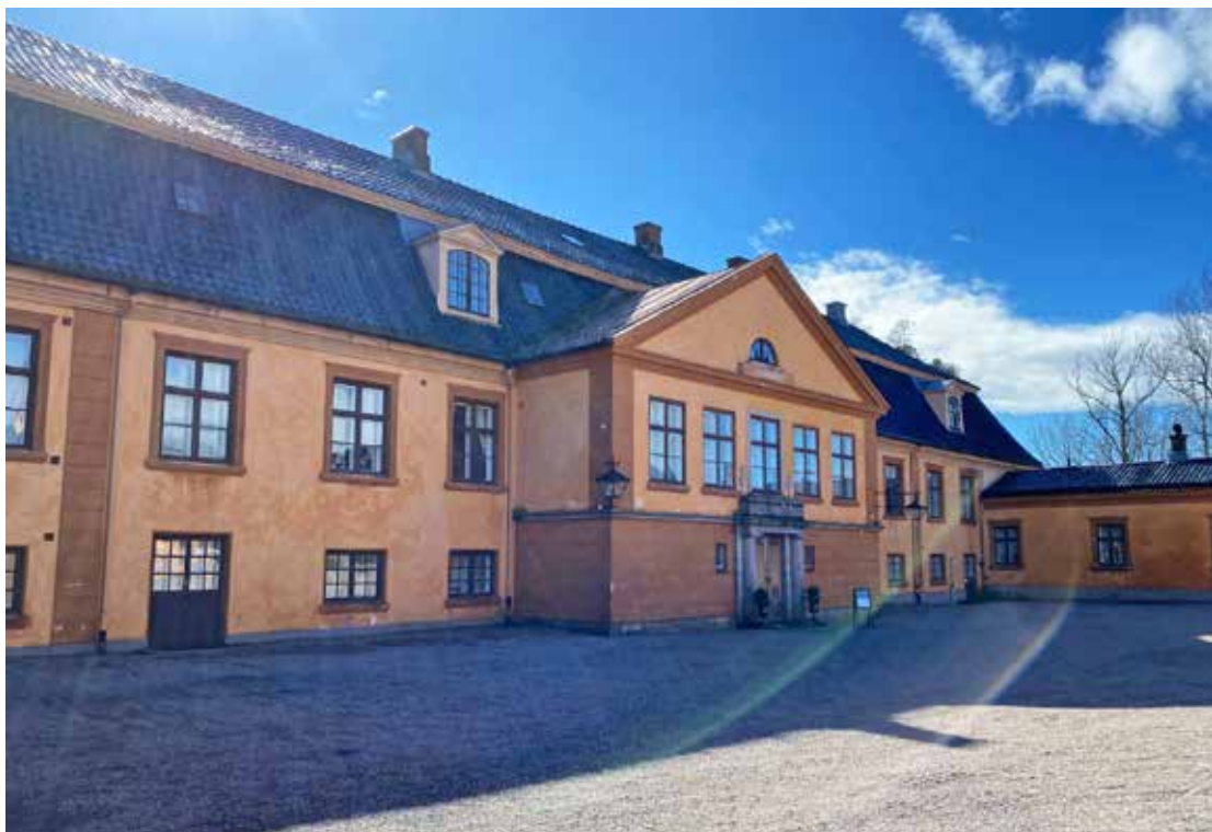
Bogstad gård ligger vakkert til ved Bogstadvannet.

Mange har hatt glede av å gå på oppdagelsesferd på Bogstad gård, - både inne og ute. Det er et yndet område for søndagsturer, utflukter med piknik og rekreasjon om sommeren på solfylte dager ikke minst på grunn av beliggenheten ved Bogstadvannet.