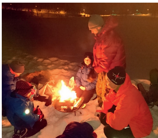
Speiderne i Voksen fra isfiske på Bogstadvannet.