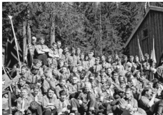
Mange speidere deltok ved innvielsen i 1961.

Ruudshøgda er en populær møteplass for KFUM-KFUK-speiderne i Røa og Voksen. Hytta ligger like ved Wyllerløypa. Øystein Torget forteller om hvordan Ruudshøgda ble til. Øystein begynte i 2. Røa KFUM-speidertropp i 1952 og er fortsatt gruppeleder!