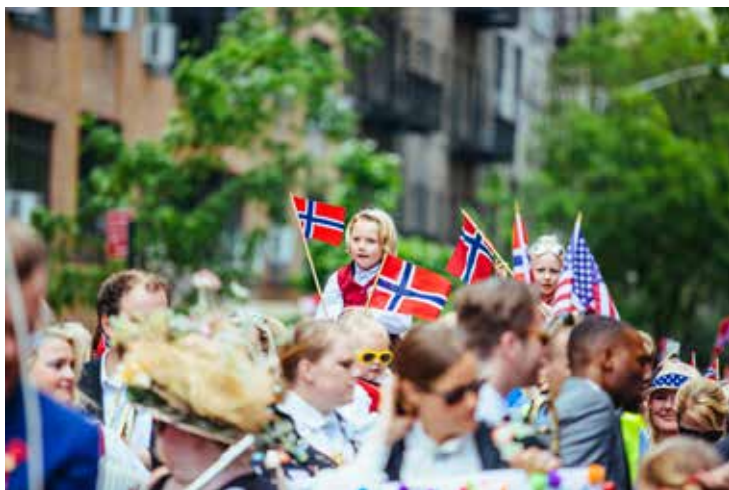
17. mai-feiring med Sjømannskirken i New York.

Sjømannskirken har en god klang i den norske offentligheten. Den oppfattes som et åpent og folkelig tilbud som møter alle slags nordmenn i utlandet, med vennlighet, omsorg og vafler. Miljøet ser mange på som uformelt, men likevel med tydelig kirkelig preg. Sjømannskirken tilbyr diakoni og omsorg for folk i trøbbel på en side, og sosialt samvær, gudstjenester og kirkelige handlinger som dåp, konfirmasjon og vielser på den annen side.