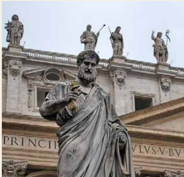
Peter med nøklene

Nøklerne som Peter bærer, er symbol på det motsatte. De var ikke private, og Peter fikk dem ikke til sitt eget bruk. Det var nøkler for alle som vil bruke dem. Nøklerne symboliserer at Peter fikk et oppdrag av Jesus: «Jeg vil gi deg himmelrikets nøkler; det du binder på jorden, skal