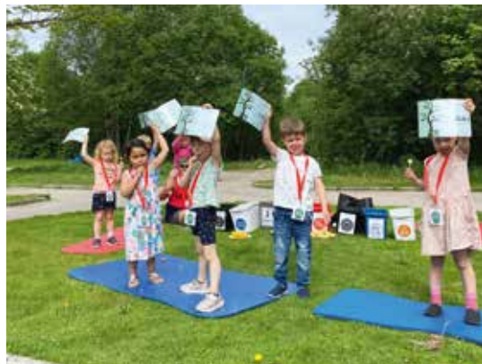
Stolte «skaperverksagenter» løfter diplomene sine.

utegudstjenesten og stod foran og ledet forsamlingen gjennom sangen «Hvem har skapt alle blomstene» sammen med trosopplæringsleder Line og diakon Espen på gitar.