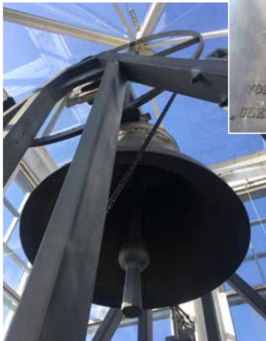
Kirkeklokken i tårnet på Voksen kirke.

Hver søndag kan mange i Voksen høre kirkeklokken ringe. Voksen kirke har en kirkeklokke som ble støpt i 1995, året da kirken ble innviet. Den ble produsert på det eneste klokkestøperiet i landet, Olsen Nauen klokkestøperi ved Tønsberg. Det er ikke mange som får anledning til å gå opp til klokken der den henger i tårnet. Vi får nøye oss med de fine bildene som er tatt av daglig leder Inger Johanne Østby.