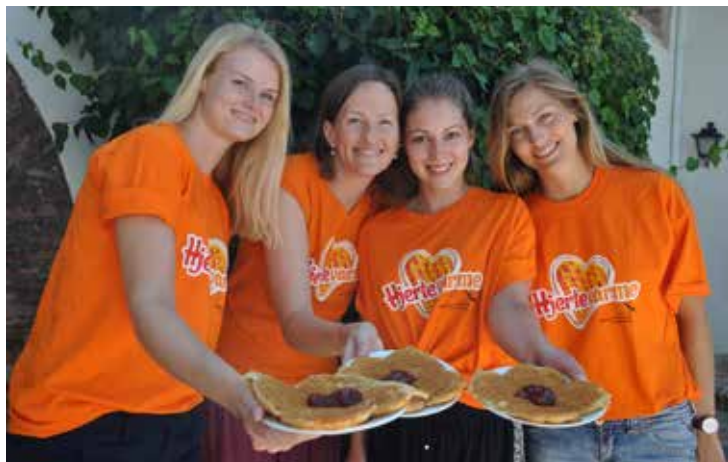
Hjertevarme unge i Sjømannskirken.

Virksomheten i dag er stor. Sjømannskirken møter nesten 700 000 mennesker i løpet av året og har tiltak i 80 land. Det finnes i alt 28 sjømannskirker, de fleste i Europa, noen i Asia og Amerika, men ingen i Afrika.