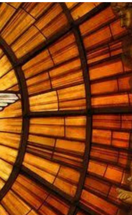
Duen er et symbol på Den hellige ånd. Fra glassmaleri i Peterskirken i Roma.

er over, selv om restriksjonene er fjernet. Det døde flere av covid i 2022 enn i 2021 og 2020, og de vanene som folk etablerte i 2020 og 2021, ble ikke lagt helt vekk, selv om restriksjonene ble opphevet.