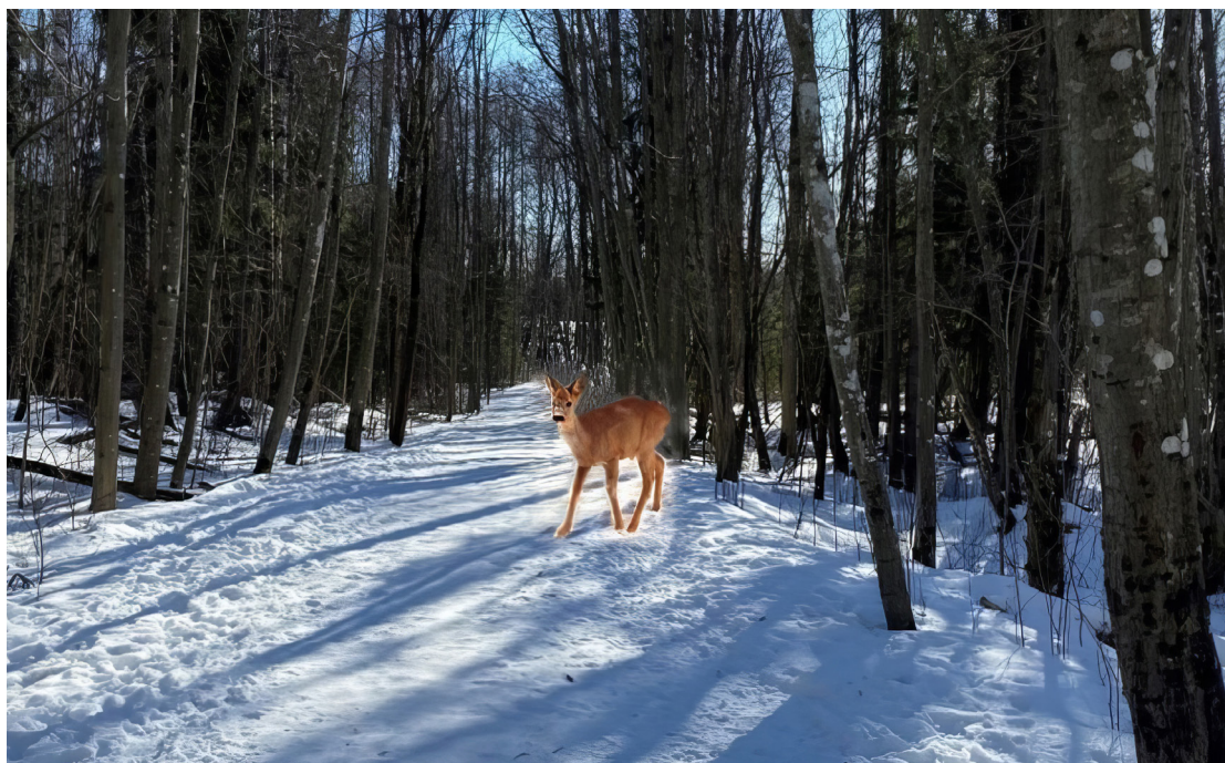
Selv i dag kan vi møte på rådyr i Mærradalsbekken.

Har du gått nedover Hovseterdalen fra Bogstad Camping til Voksen kirke noen gang? Det bør du gjøre. Følg den lille Mærradalsbekken. Det pussige navnet Mærradalen er muligens en forvanskning av «Marias dal». Når jeg rusler langs bekken, slår det meg at folk har vandret her i 10 000 år, helt siden den siste store innlandsisen trakk seg tilbake omkring 8000 f.Kr. Da var det jeger- og samlerefolk som levde her, og det er funnet