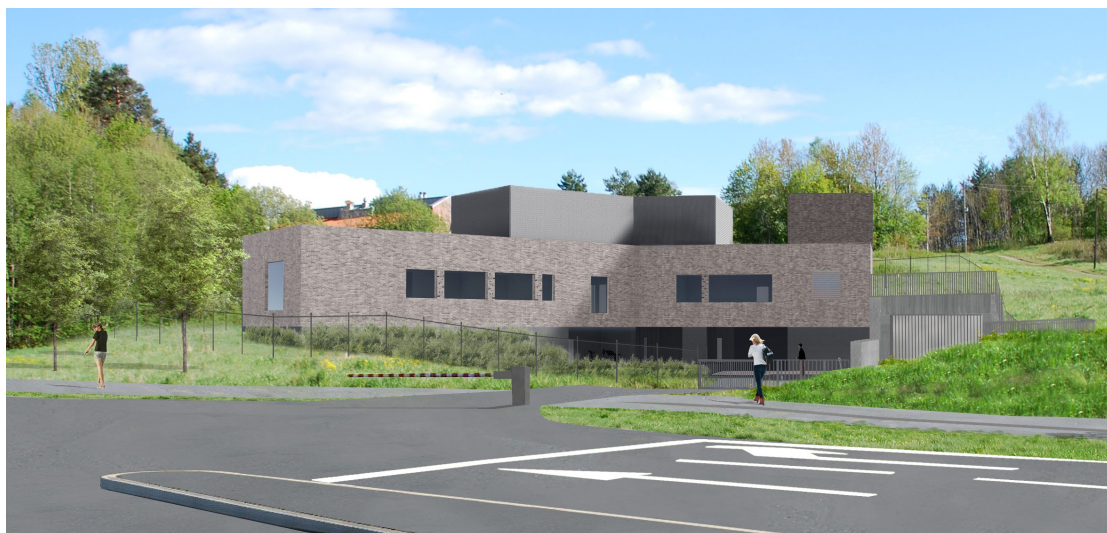
Slik vil driftsbygget på Huseby se ut når arbeidene er ferdig i 2028.

De fleste har sett de store arbeidene som foregår på Husebyjordet ved Gardleiren. Under bakken bygges et stort og topp moderne vannbehandlingsanlegg. I dag er det et stort anleggsområde, men etter hvert vil et lite driftsbygg være eneste synlige installasjon på Husebyjordet.