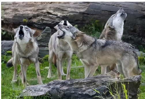
For 160 år siden kunne man ofte høre ulvehyl i Hovseterdalen.

I dag kan du rusle trygt nedover Hovseterdalen og nyte naturen og alle de fargerike blomstene. Ulvene holder seg unna.