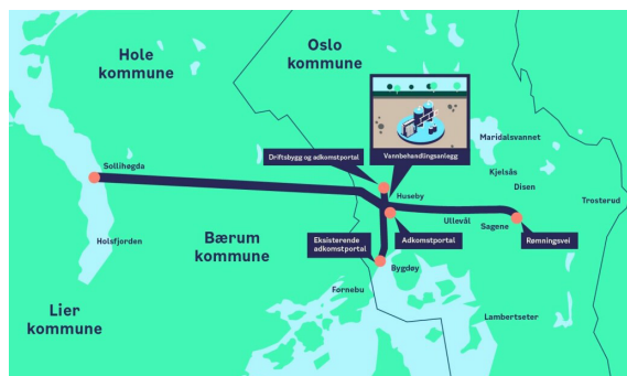
Tunnelene for ny vannforsyning.

Tunnelen skal føre vann fra Holsfjorden til vannbehandlingsanlegget på Huseby. Fra Huseby skal det bygges en rentvannstunnel som skal kobles til byens allerede eksisterende vannledningsnett.