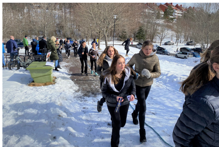
Deltakerne løp inn 124 808 kroner i årets aksjonsløp.

musikk, konfirmanter som sang «vann-sanger» og mange som heiet på deltakerne. Noen med forskjellige kostymer skapte liv og røre. En konfirmant stilte som en vanddråpe og en annen som kylling. Espen diakon var julenisse mens kapellan Johannes var hare.