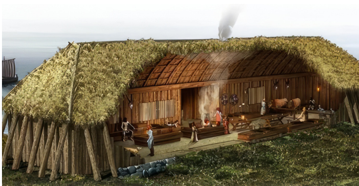
Dette langhuset er kanskje ikke drømmeboligen i dag?

Omgangsskole ble etablert og den varte fram til 1860. Skolen holdt til noen dager eller uker på hver gård i området. Lærere måtte ofte ta til takke med kummerlig nattelosji, i ekstreme tilfeller delte de seng med bonden og