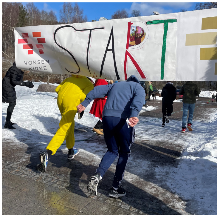
Starten går for årets aksjonsløp.

De som løp aksjonsløpet, inviterte folk i nettverket sitt til å sponse dem når de løp etter gudstjenesten. Under aksjonsløpet var det god stemning med speaker og