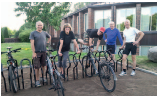
Arbeidsgjengen som gjennomførte sykkelparkeringen