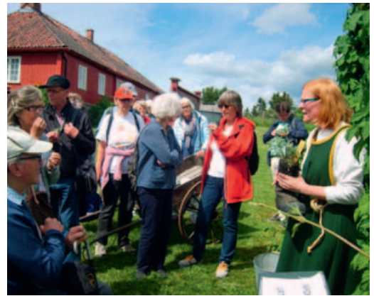
Fra urtehagen på Domkirkeodden