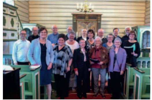
Koret synger i Nissedal kirke