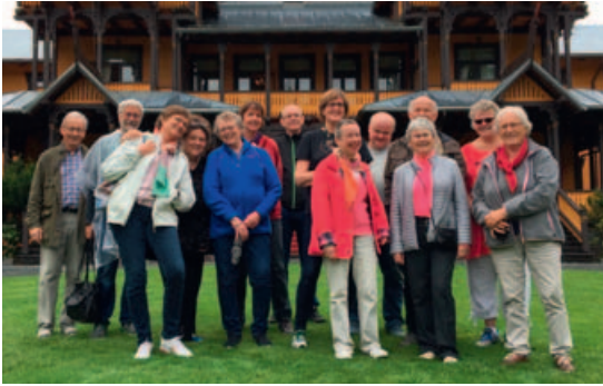
Voksen kirkekors tur til Telemark