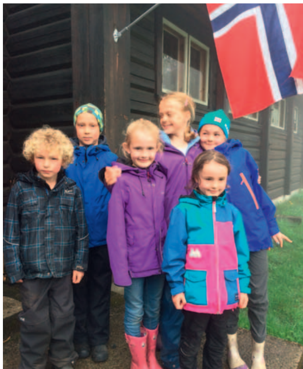
På speidergudstjeneste i Haslumseter kapell