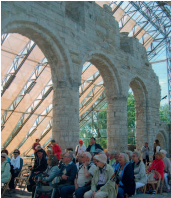
Fra sommerturen til Domkirkeodden på Hamar