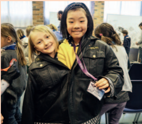
Det er god plass i en politiuniform!