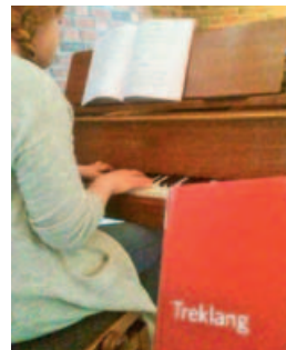
Fra «Treklang fra A-Å» i kapellet.

Så langt i år har vi ha hatt arrangementet «Treklang fra A-Å». Akkompagnert av band, sang vi gjennom de sangene vi liker fra Treklang!