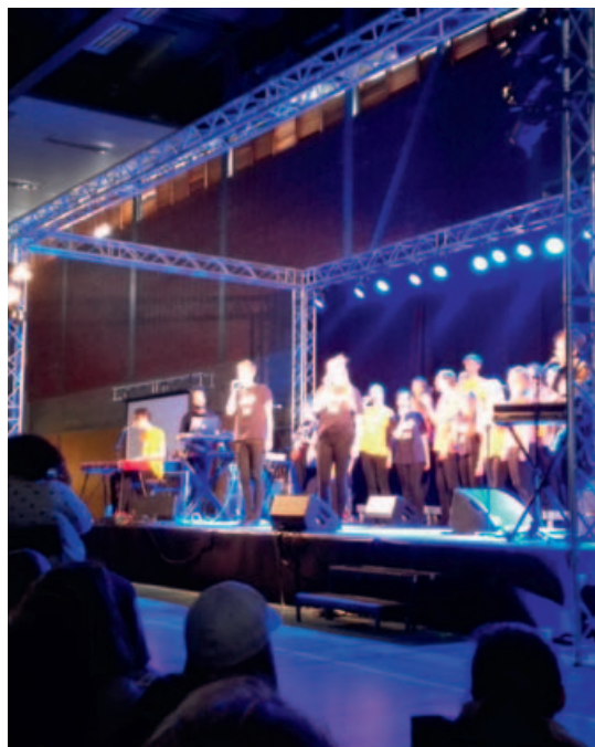
Tensing Norway-konsert på konfirmantfestivalen.»

Et møte av ungdommer, for ungdommer. En gang i måneden. Se mer på våre hjemmesider.