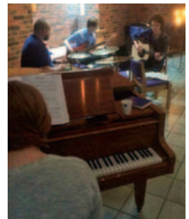
Bandet fra «Treklang fra A-Å»