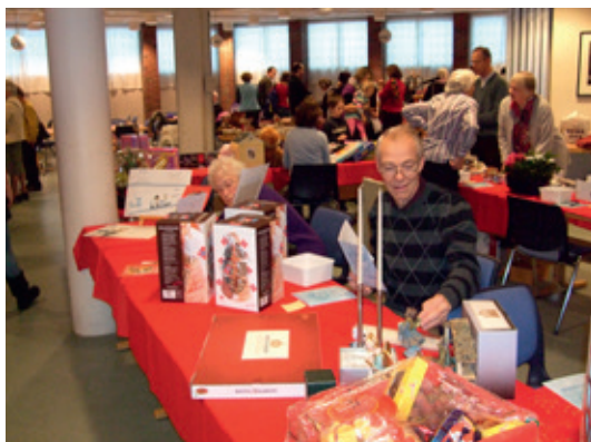
Fullt liv i kirken under Voksenmessen.