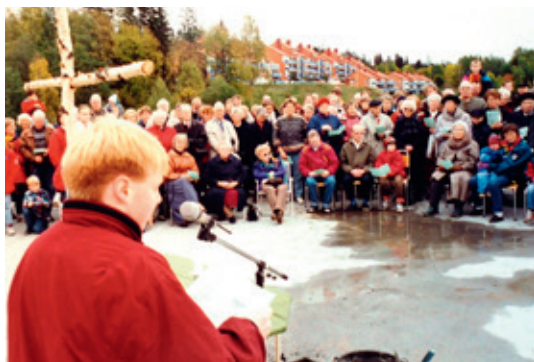
Menigheten samlet på det som etterhvert skal bli kirkebakken.