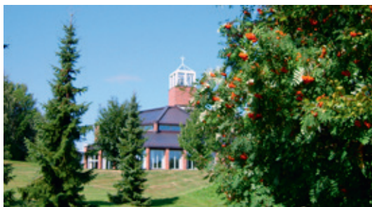
Kirken i dag