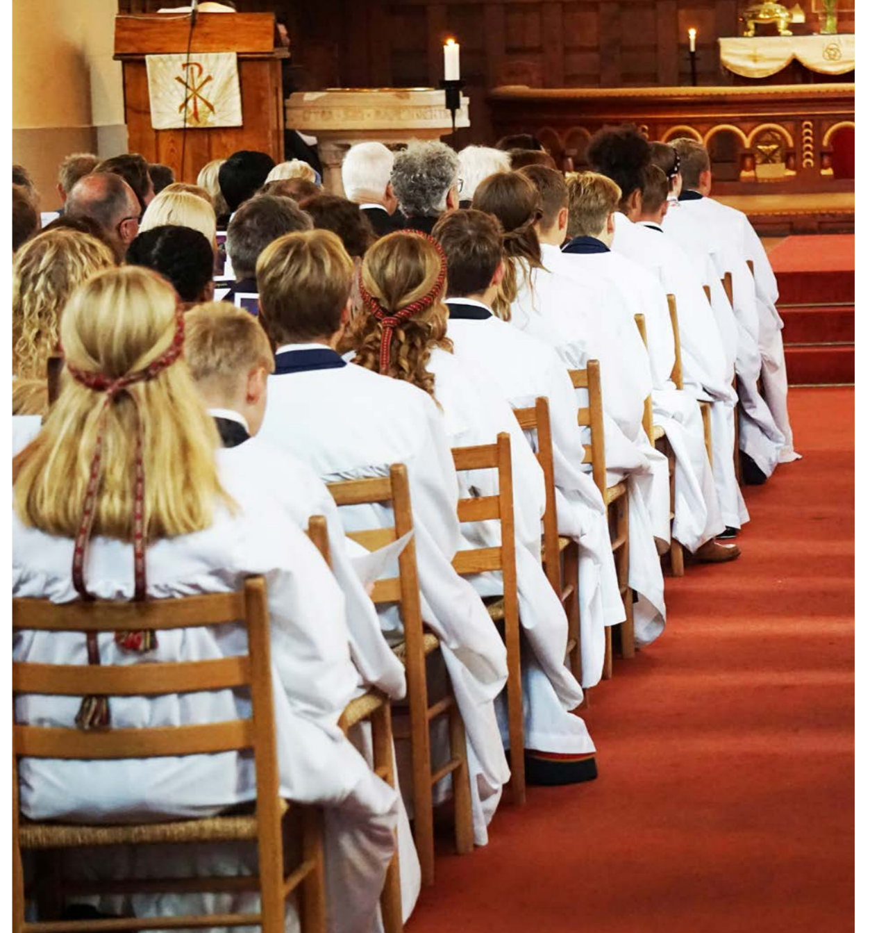
Konfirmanttallene i Oslo er stabile, men med en positiv tendens.

Antall konfirmerte var lavere enn i rekordåret 2021, men høyere enn i alle de fire siste årene før pandemi-