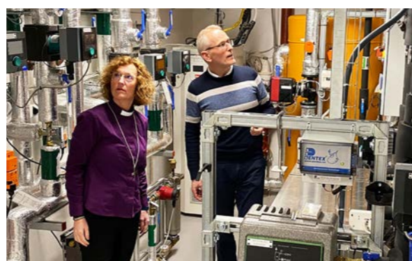
Biskop og kirkeverge lar seg imponere av de moderne energiltakene på Torshov kirke. s. 30-31