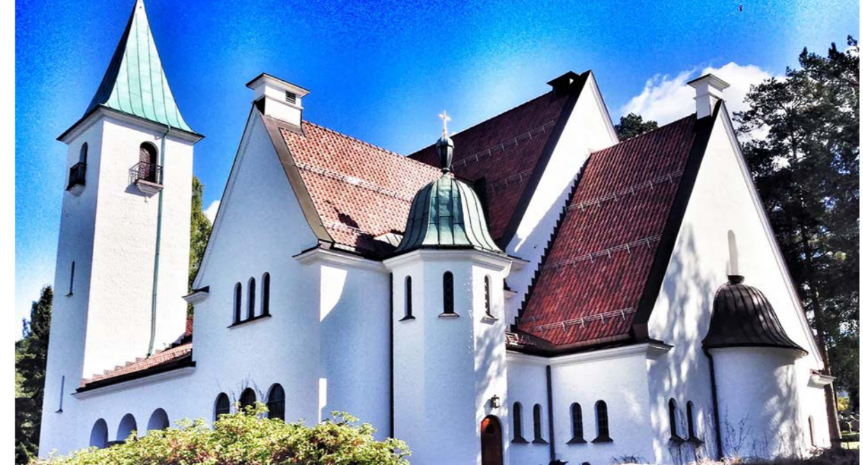
Bekkelaget kirke er nyrenovert til 100-års jubileet.