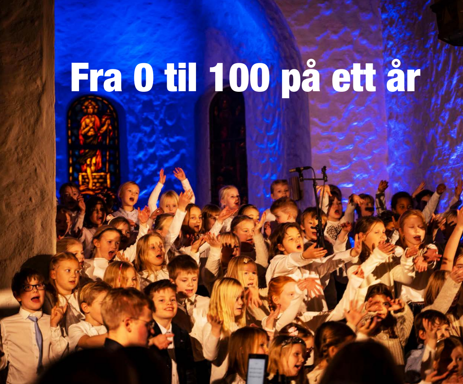
På kort tid har Ljan fått et stort kor med entusiastiske barn.