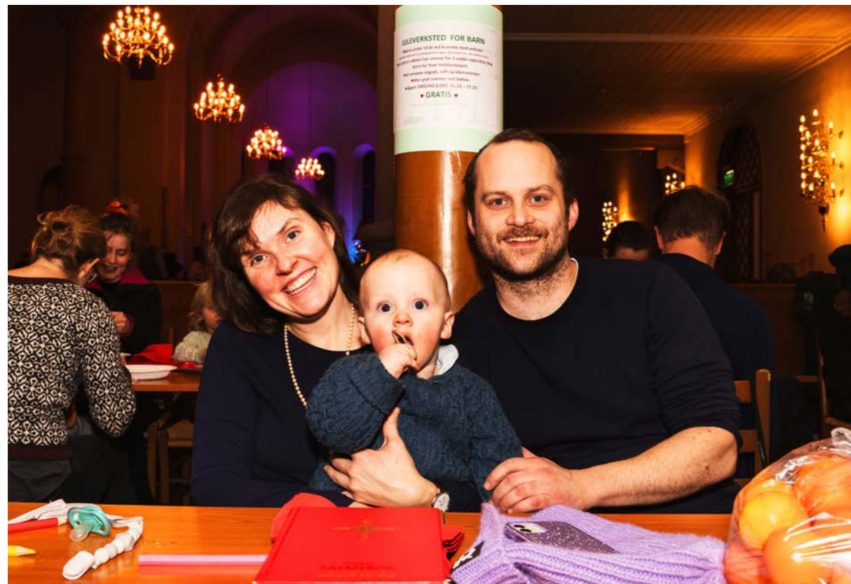
Tirsdagsmiddagen i Grønland kirke samler små og store fra lokalmiljøet.

I Grønland kirke er ambisjonen at alle skal bli møtt med omsorg og aksept, uansett hvem de er. Diakonien står sentralt. Kirken skal være tjenende og la budskapet om Jesus Kristus og Guds kjærlighet være tydelig i alt de gjør.