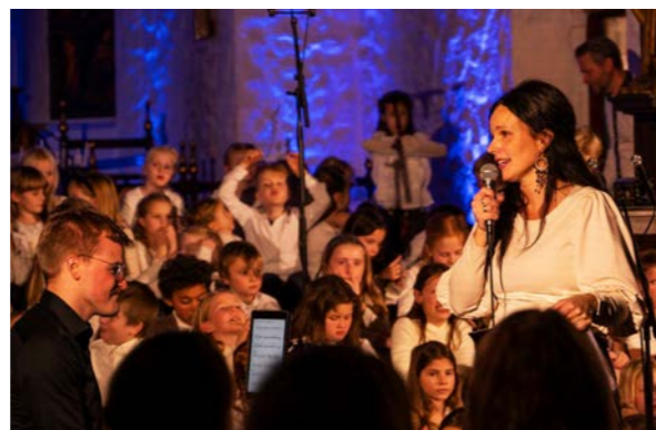
Les om et spennende samarbeid mellom skole og kirke på Ljan. s. 12-14

Kirkelig fellesråd i Oslo DEN NORSKE KIRKE