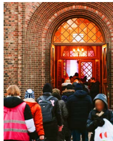
Hver onsdag og fredag er det matutdeling i Grønland kirke.