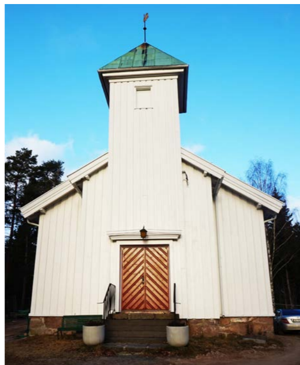
Maridalen kirke, 2023.