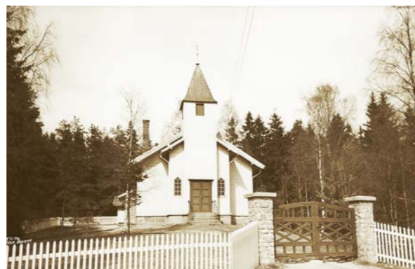
Den fagre Maridal er bygda i byen, og nå bygges det på den lille kirken. s. 26-28