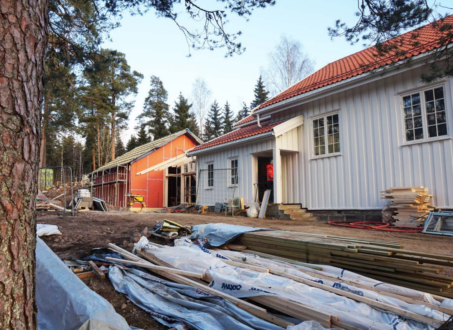
Maridalen kirke har fått et diskret og etterlengtet tilbygg på baksiden.