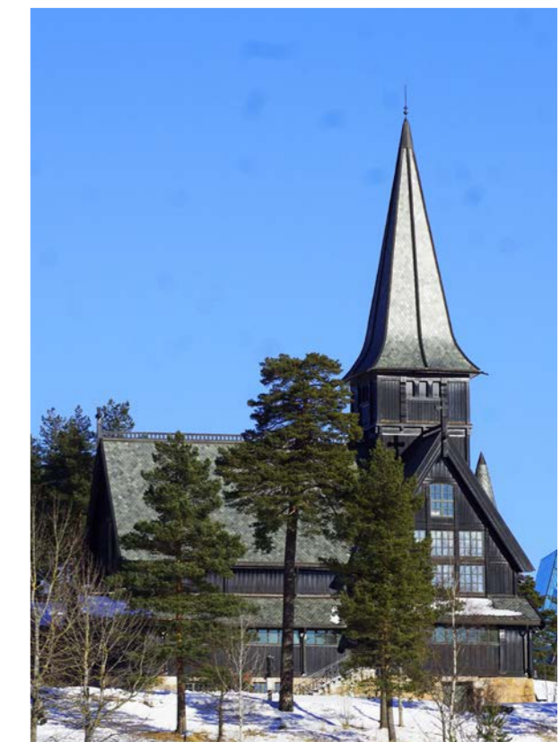
Store råteskader er utbedret på Holmenkollen kapell.

har gått inn med midler for å oppgradere en nedslitt jubilant. Innearealer er malt og rehabilitert, kirken har fått ny belysning, nytt kjøkken og toaletter i kjeller. Dessuten er menighetssalen bygget om. Kirken har også fått vannbåren varme og nye tepper. Bekkelaget sokn ble utskilt fra Nordstrand i 1913. Ti år senere stod kirken ferdig. Da som nå var den flotte hvitkalkede langkirken resultat av frivillig innsats og lokal offervilje.