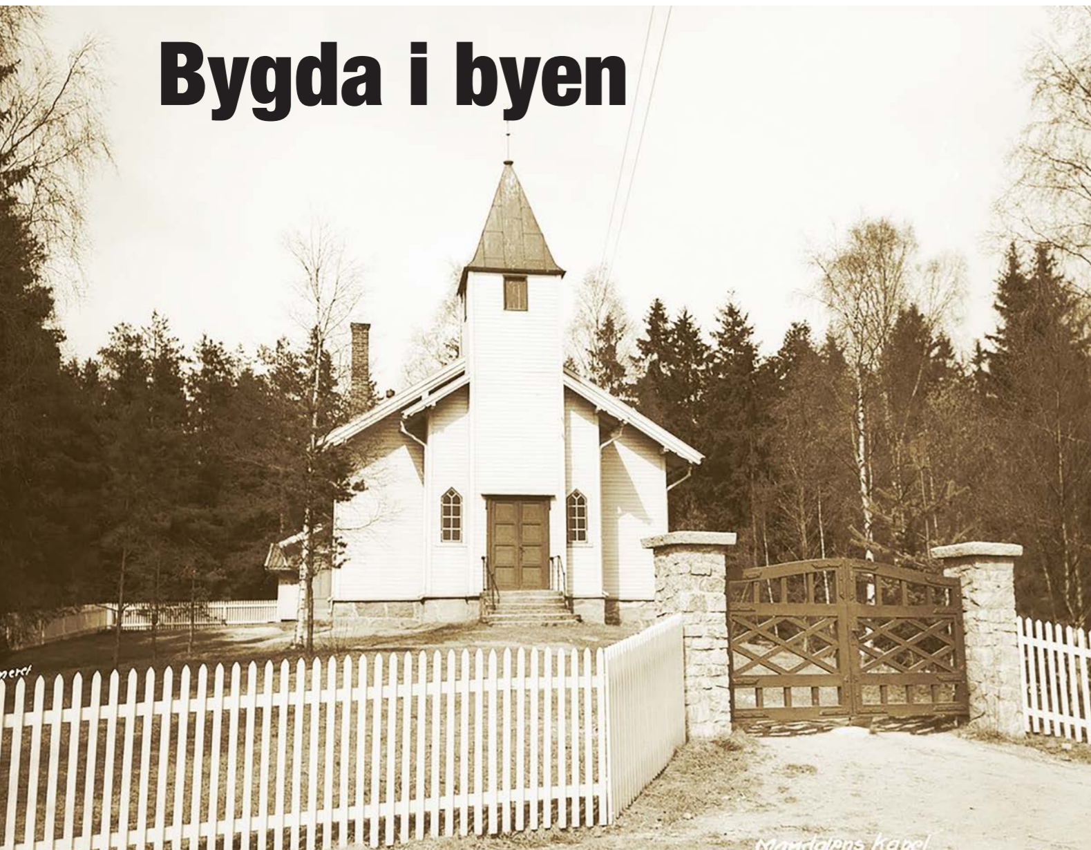
Maridalen kirke med stakittgjerde, slik den så ut frem til renoveringen i 1959.

Maridalen er det minste soknet i Oslo med 582 innbyggere og byens høyeste medlemsprosent (70%) i Den norske kirke. Tett på hovedstadens sentrum og samtidig langt ute på landet. Bygda bærer på en stolt kirkehistorie, og nå har maridølene reist et nytt, flott tilbygg til kirken.