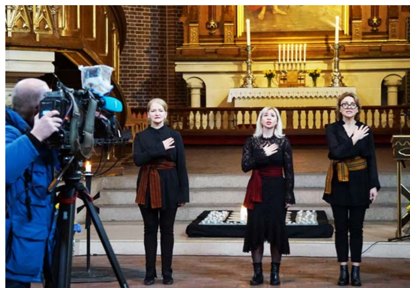
Ukrainsk sanggruppe synger nasjonalsangen på ettårsmarkeringen av invasjonen.