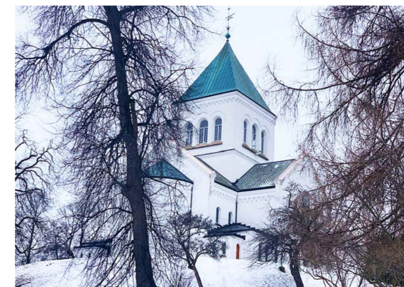
Ullern kirke kneiser flott i nyromansk stil med utsyn mot Bestumkilen.

-Hovedfortellingen er at vi ikke har rasisme i Norge. Det glansbildet har