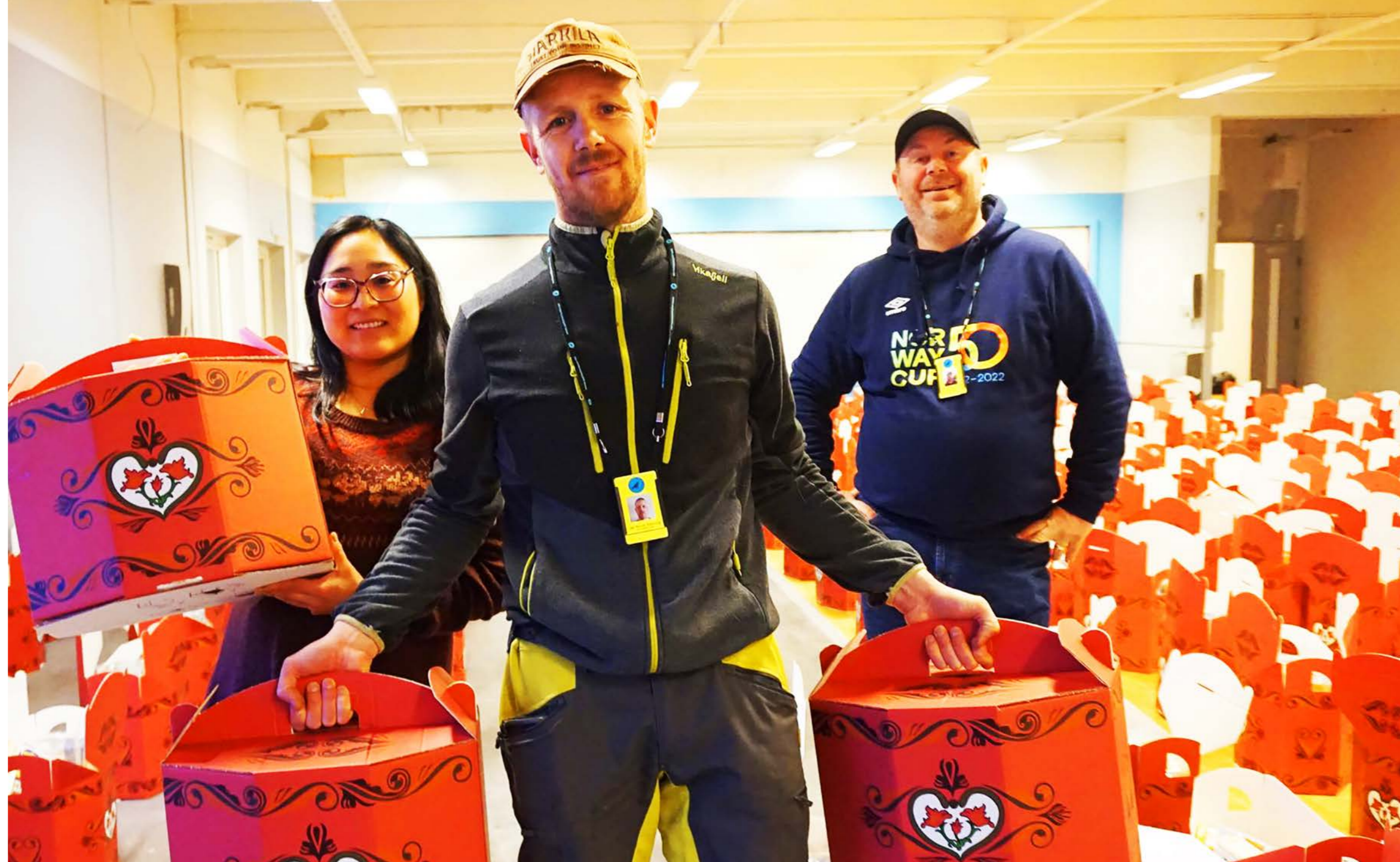
Fornøyd dugnadsgjeng etter pakking av 500 gaveesker.