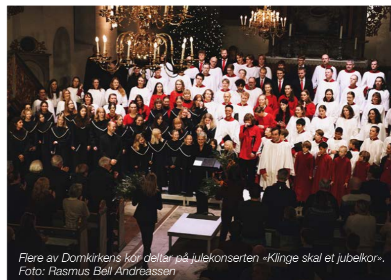
Flere av Domkirkens kor deltar på julekonserten «Klinge skal et jubelkor».

Oslo Domkirke er biskopens og hele bispedømmets kirke. Den het opprinnelig Vår Frelses kirke. Kirken stod ferdig i 1697, og var hovedstadens eneste sognekirke frem til Trefoldighet ble innviet på Hammersborg i 1858. Det ble brukt byggemateriale både fra kirkeruiner fra Gamlebyen og Hellig Trefoldighetskirke, som lå der domkirken ligger nå. Kirken har vært igjennom flere ombygginger. De berømte takmaleriene til Hugo Lous Mohr var ferdige i 1950.