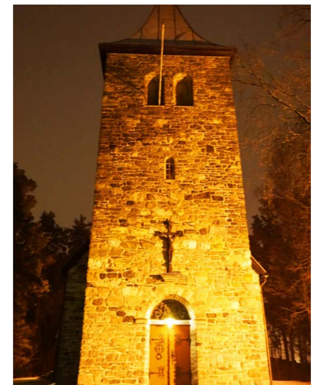
Ljan kirke fra 1932 er inspirert av middelalderarkitektur, men er likevel et populært sanglokale for barn i alle aldre.