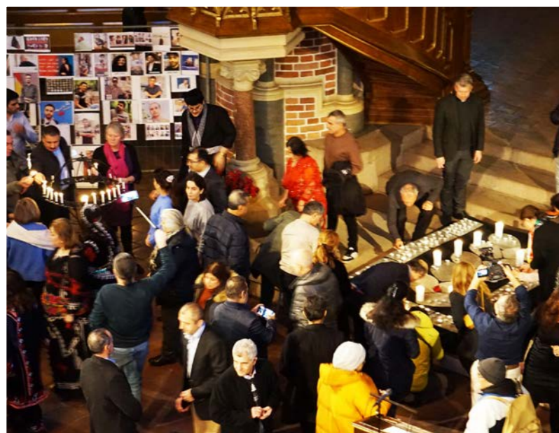
Solidaritetsmarkering for det iranske folk.

sentrum arrangerer kirken møtesteder for alle som søker forsoning og fred mellom folk og nasjoner med skaperverket og med Gud.