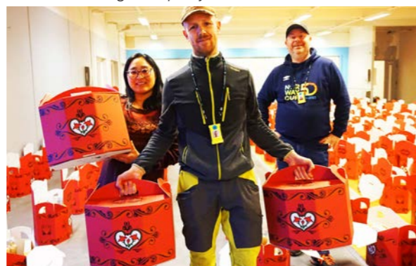
Grorud menighet kastet seg rundt og delte ut mat til trengende. s. 22-23