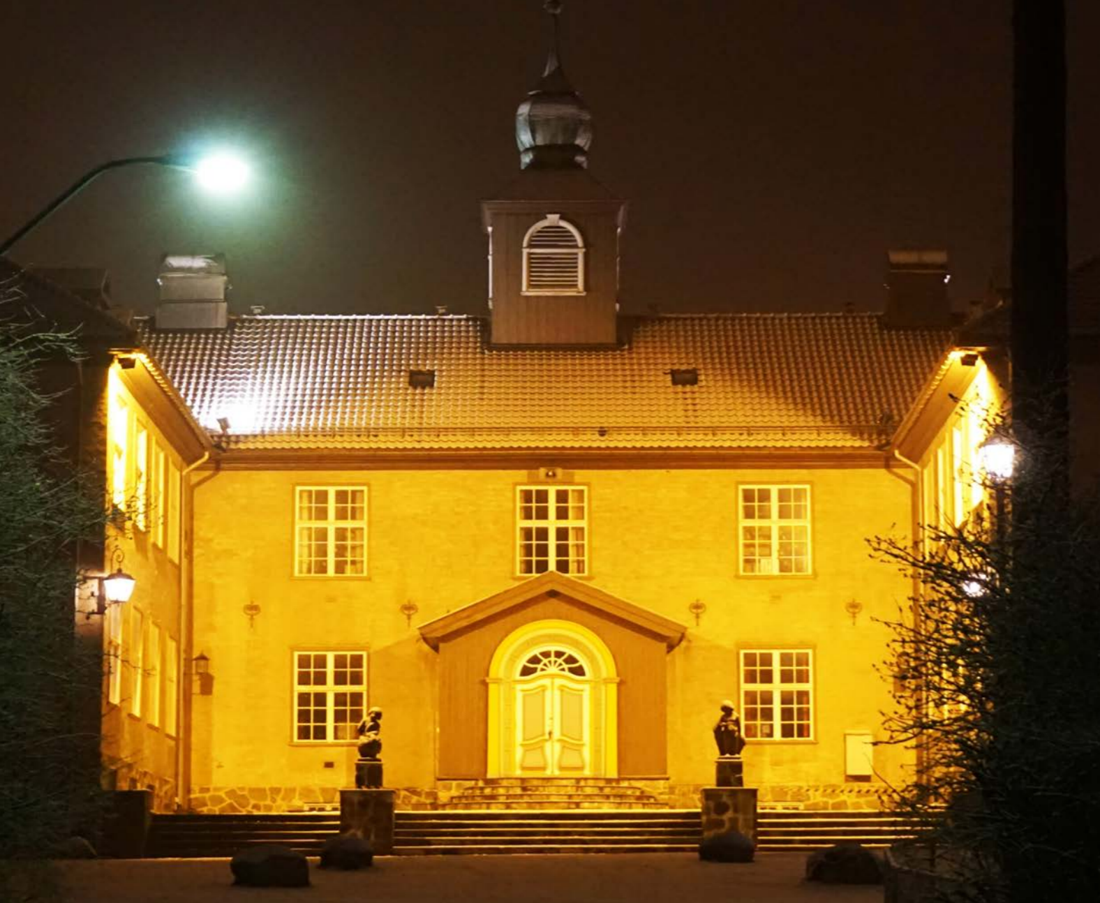
Ljan skole (1923) er bygget etter mønster av herregården på Stubljan, og er nærmeste nabo til kirken. Da blir det kort vei for et godt samarbeid.