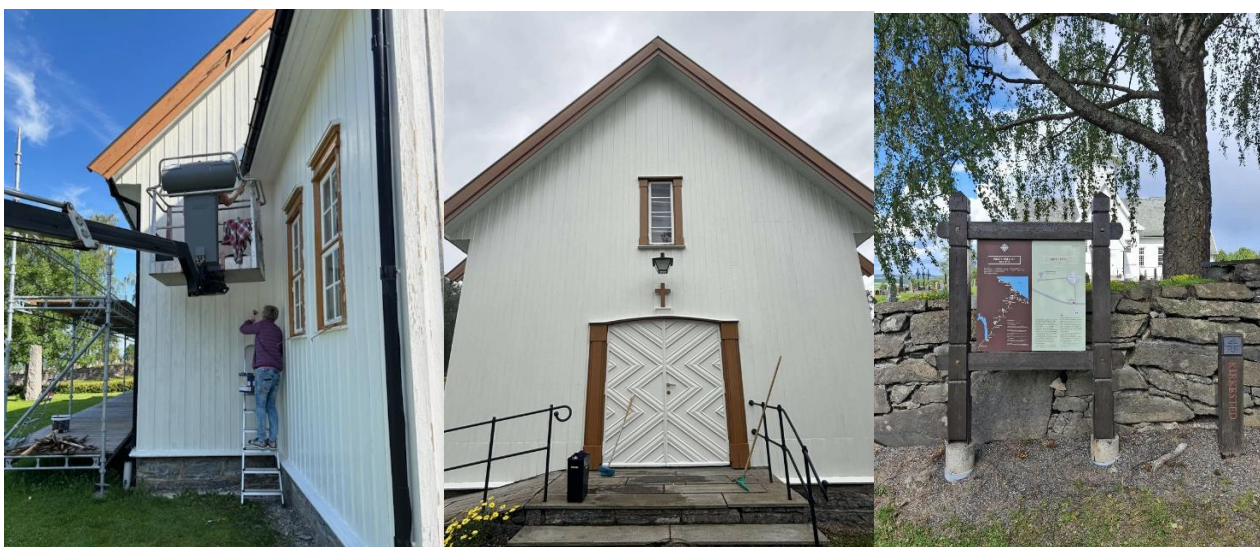
Kirkestua har blitt malt utvendig på dugnad. Dugnadsgjengen ble takket på kirkecaffe etter høsttakkefesten.

Kveldsbønn på første torsdagen i mnd. i høstsemesteret