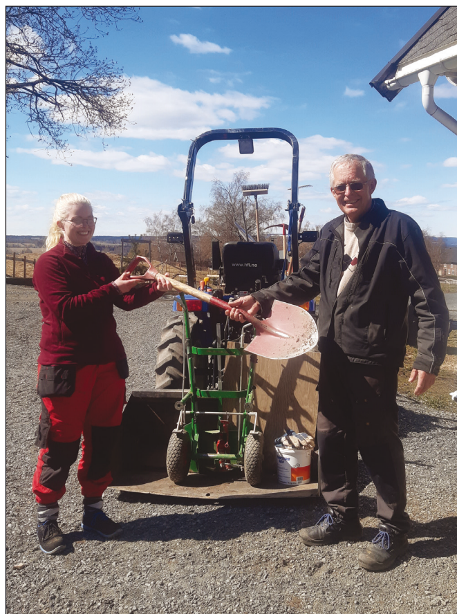
Aage gir spaden videre til Kolbu's nye kirketjener.

Jeg må også få si at jeg har møtt mange trivelig folk i Kolbu. Det er mange som har tilhørighet til kirka og særlig til kirkegården. Å møte folk til hverdags og i glede og sorg er nok det jeg kommer til å savne mest. Jeg tror kirka betyr mye for folk i Kolbu.