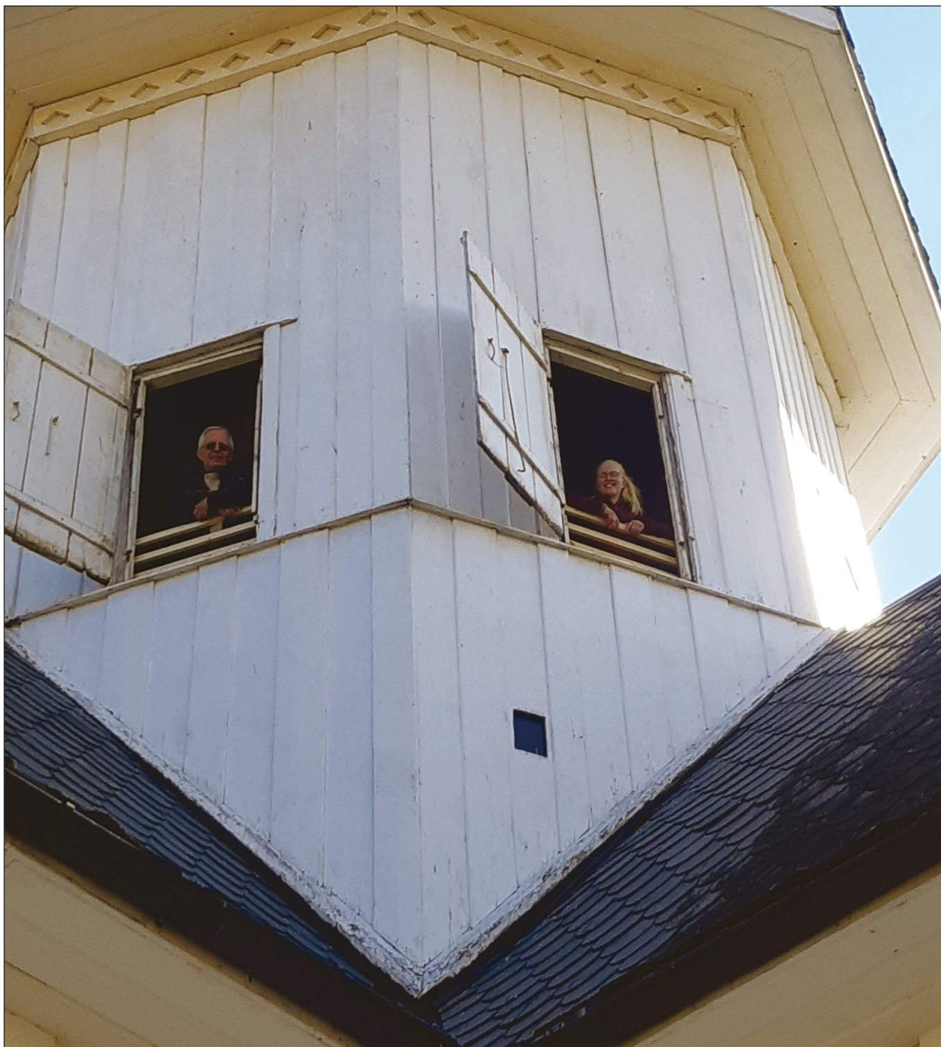
To kirketjenere i klokketårnet.