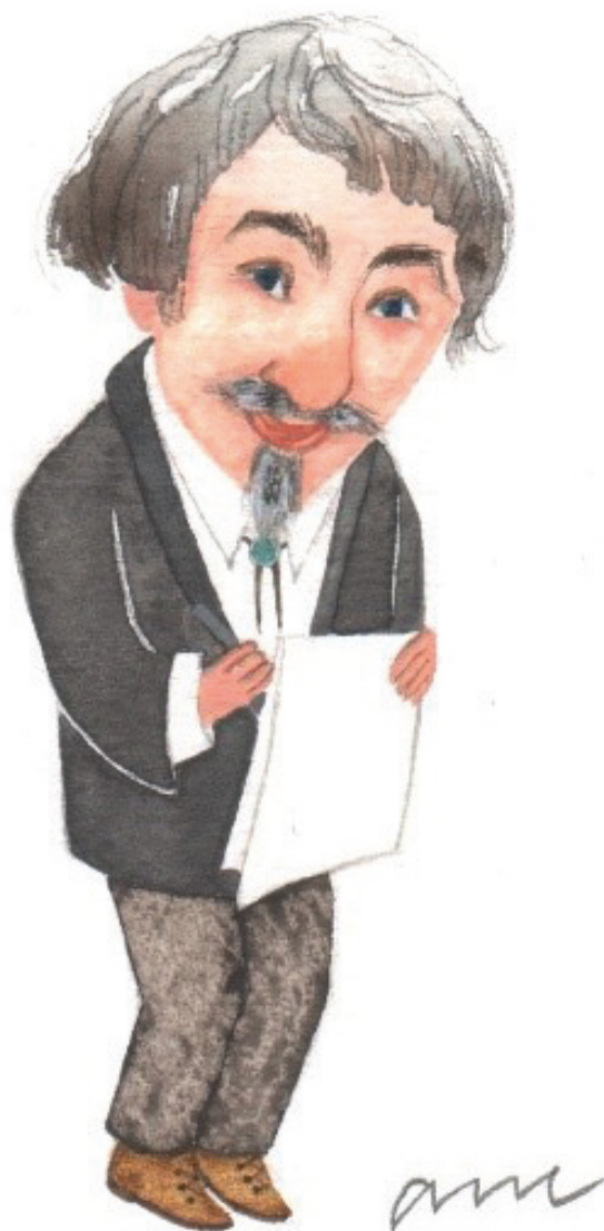
Illustrasjon: Ane Gustavsson (IKO).