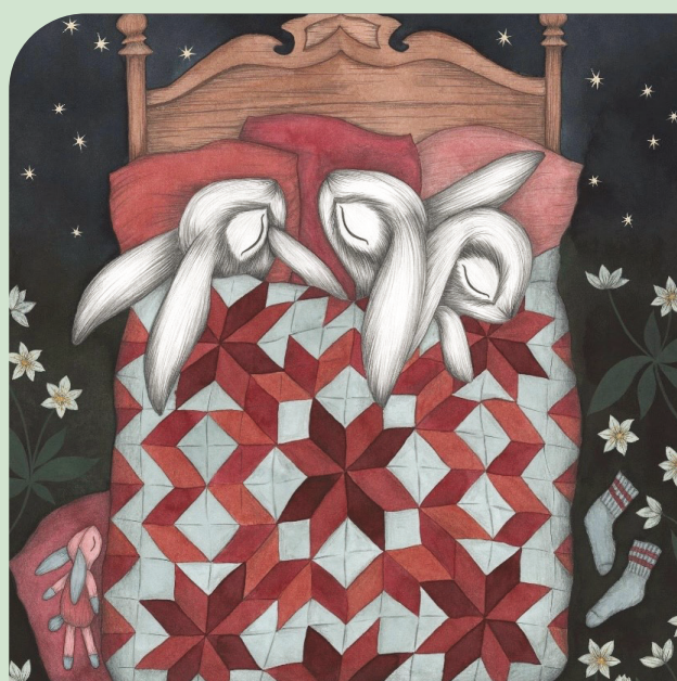
Illustrasjon: Kajsa Wallin.