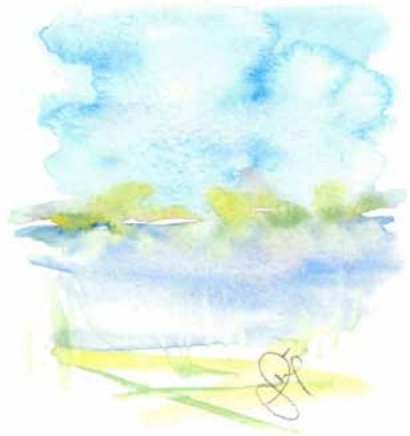
Akvarell av Live Narum.

Jeg synger meg en blå, blå salme Til deg du Hånd som sanker og som sår Og senker deg min signing over jorden Med legedom for alle våre sår. Som byr oss rette ryggen Stå opp i og gå i strid. Med løftet hode skal hver en sjel Gå inn i Herrens tid. Så synger vi vår salme.