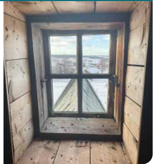
Vindu i kolbu kirke

«Selv om en har gode rutiner, brannvarslingsanlegg og andre tiltak, kan brann oppstå», sier Bergheim. «Kirkevergen har derfor utarbeidet en liste over verdier en må prioritere å redde dersom det oppstår brann.»