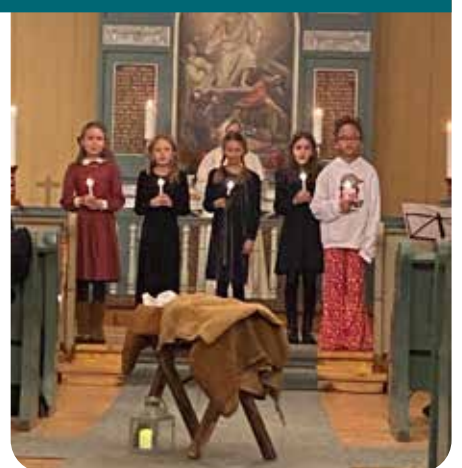
Sanggruppa med lys