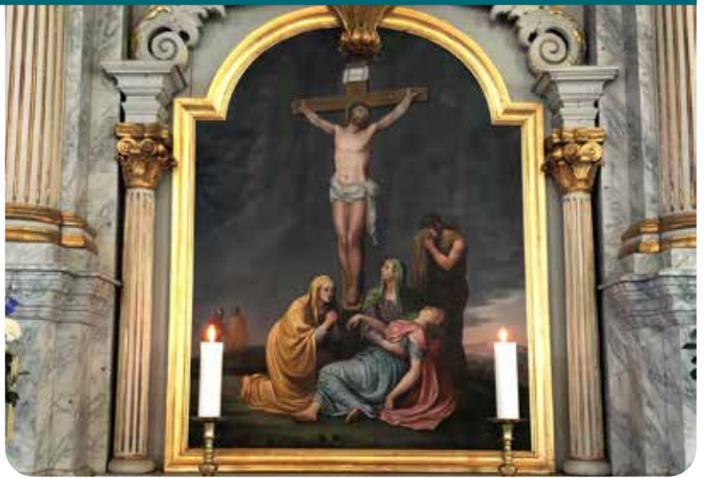
Altertavle Sør-Fron beskåret.

Vi feirer ikke påske fordi Jesus døde på korset. Vi feirer påske fordi fortsettelse følger.