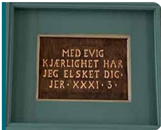
Katekismetavle fra Kolbu kirke.

Bønnen i Getsemane er som et ekko fra Fadervår: «La viljen din skje på jorden, slik som i himmelen». Det er ikke en bekreftelse på at alt som skjer på jorden er Guds plan. Det er en bønn om at Guds himmelske vilje skal skje, i alt som møter oss på jorden. Også i møte med lidelse og død. At noe skal nyskapes.