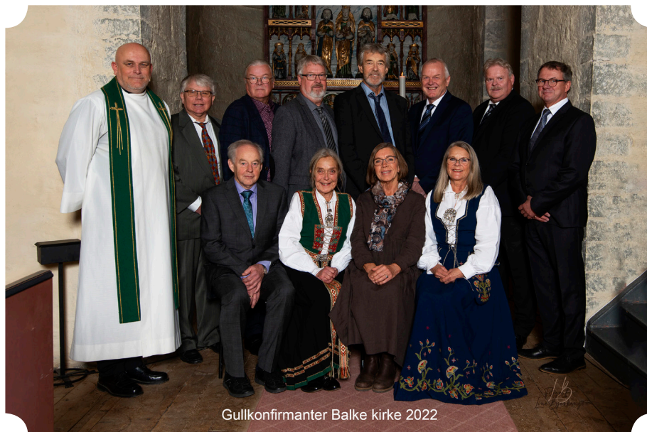
Gullkonfirmanter Balke kirke 2022

Søndag 30. oktober var elleve av årets gullkonfirmanter samlet til gudstjeneste i Balke kirke, med påfølgende feiring på Balke menighetshus.