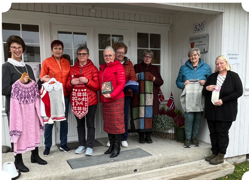
Tekst og foto: Bente Skjølås

En torsdag i slutten av oktober var Tirsdagsklubben igjen samlet for å strikke og sy, og for å forberede høstens store basar, som ble avholdt i november. I 40 år har medlemmer i Tirsdagsklubben jobbet for å skaffe penger til menighetshuset, og mye takket være deres iherdige innsats framstår huset slik det gjør i dag! Denne torsdagen tok de seg litt tid til å feire seg selv, men de driftige damene hadde ikke lagt opp til noen storstilt feiring. Det ble en liten markering ved kaffebordet som var pyntet med blomster og flagg. Totengospel spanderte marsipankake og presten var innom med god sjokolade fra menighetsrådet.