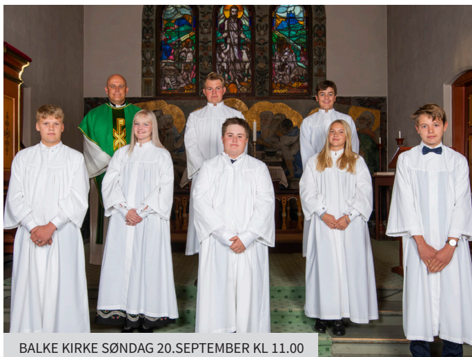
BALKE KIRKE SØNDAG 20.SEPTEMBER KL 11.00