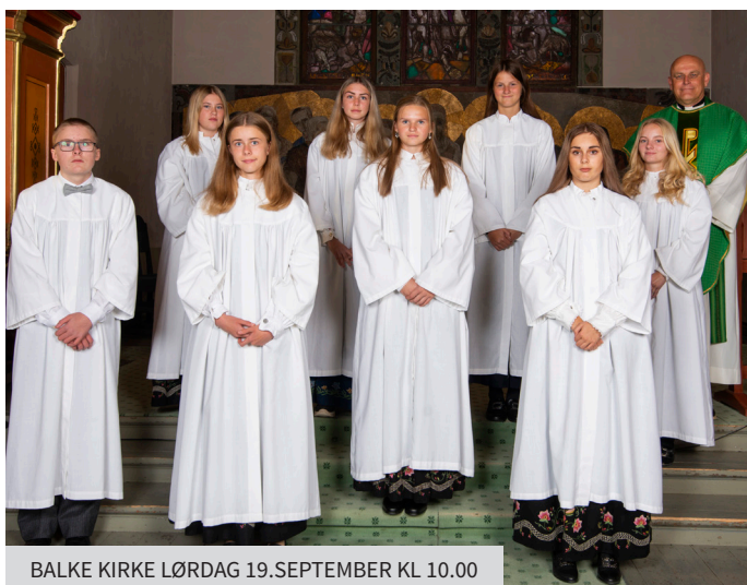
BALKE KIRKE LØRDAG 19.SEPTEMBER KL 10.00