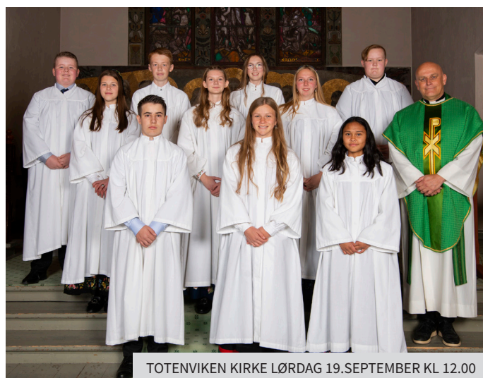
TOTENVIKEN KIRKE LØRDAG 19.SEPTEMBER KL 12.00