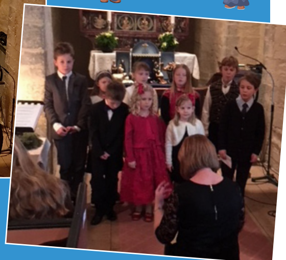
Det var første gang de var med julaften.