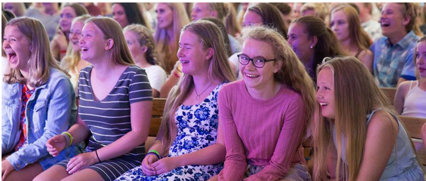
Fra konfirmantleiren i Kragerø