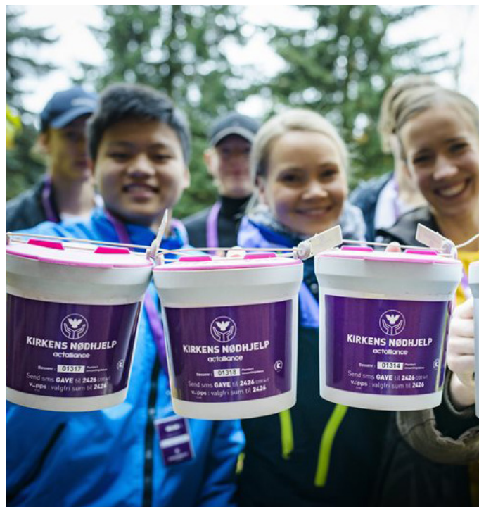
Støtt kirkens nødhjelp.

Fattigdom er urettferdighet. Det er nok rent vann og mat til alle, men spillereglene gjør de rikeste rikere og de fattigste fattigere. Sammen kan vi gi de