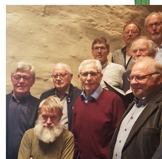
Viken Mannskor i Balke kirke 20. mai.