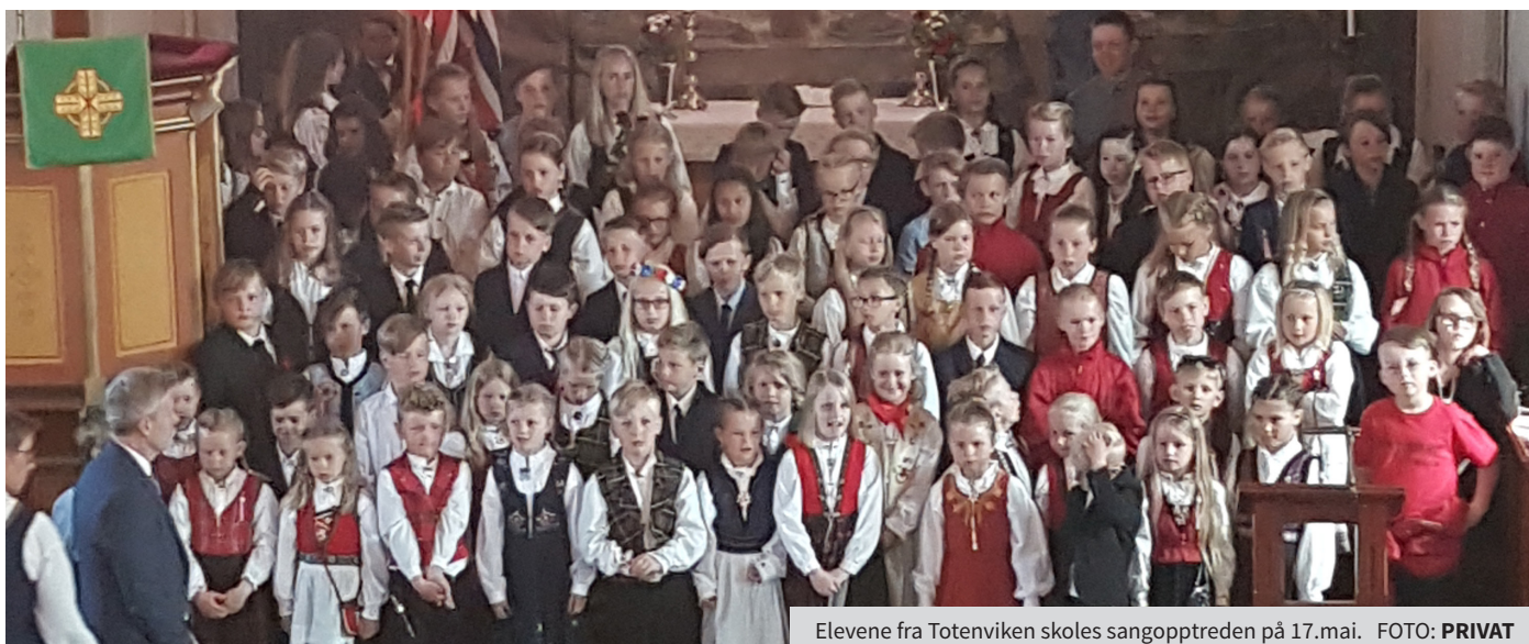
Elevene fra Totenviken skoles sangopptreden på 17.mai.