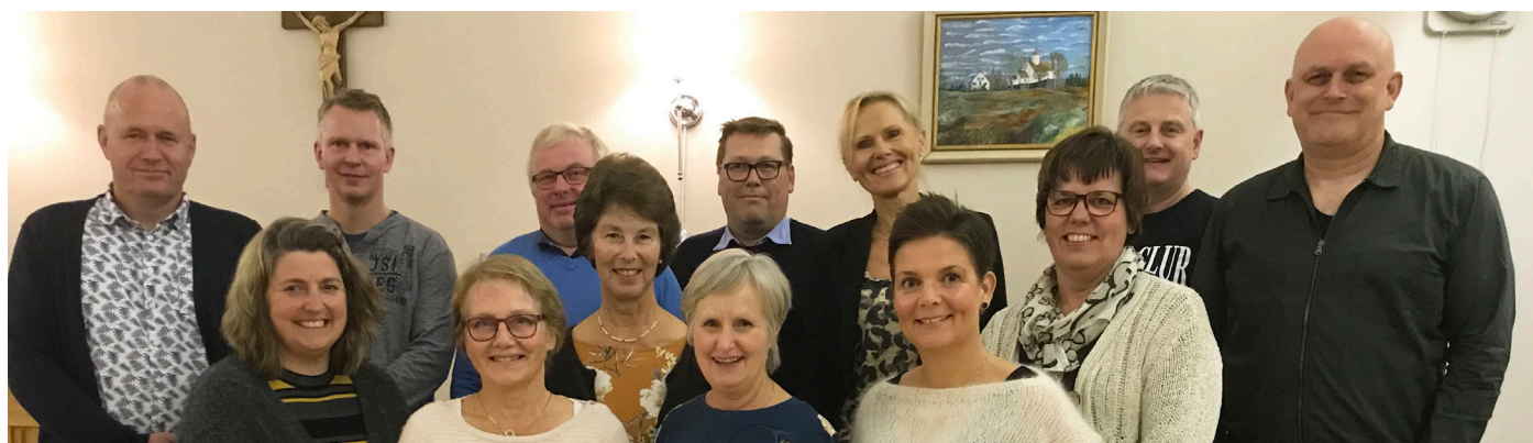
FOTO: PÅTROPPEDE MENIGHETS RÅD 2019-2023.

Menighetsrådet ble valgt 8.- 9. september 2019.