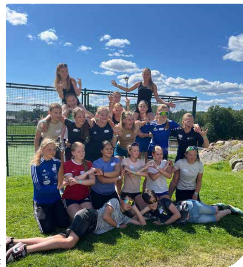
Nye konfirmanter på leir i Grimstad sommeren 2024.