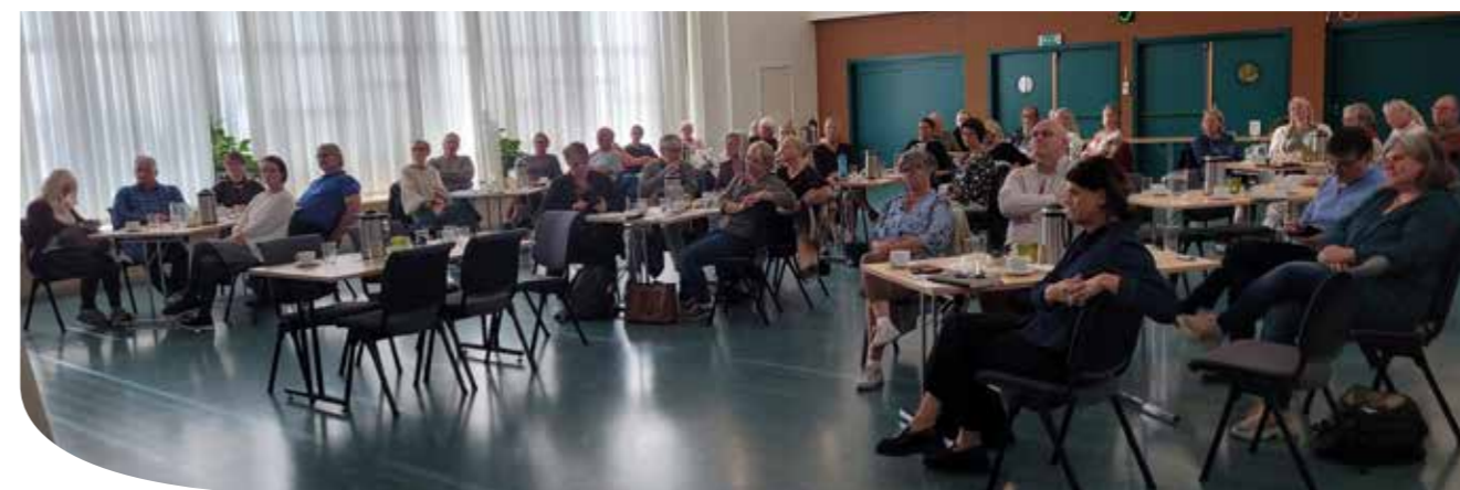
Ansatte og rådsmedlemmer deltok på møtet