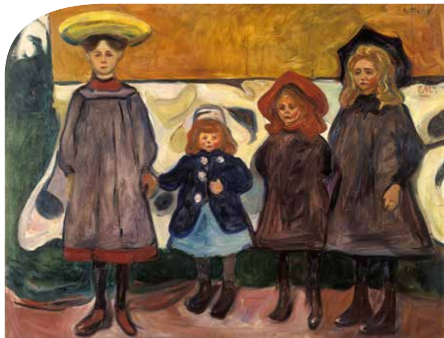
Edvard Munch - Fire jenter i Åsgårdstrand

Dette er en ode til de gutta og de jentene som måtte gi tapt i kampen mot mørket for de var fine folk de der helt fremst i frontlinjen så ble det for mørkt der og det er for dem vi skal slåss med lysbrytere festet på knokene for vi kan ikke ha det sånn at svarte natta bare skal valse rundt og ta for seg