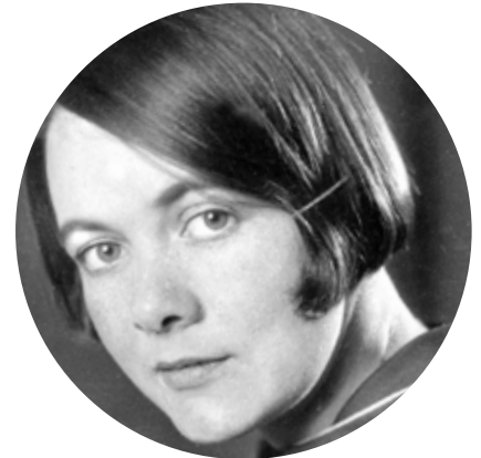
Karin Boye funnen død

Karin Boye vart fødd i Göteborg i 1900. Da ho døydde i 1941, skreiv Haldis Moren Vesaas dette minnediktet til henne –