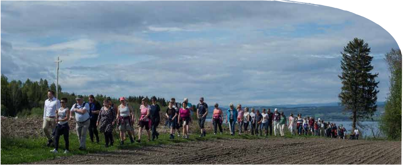
Mange deltok på pilegrimsvandring fra Kapp kirke til Hoff kirke.