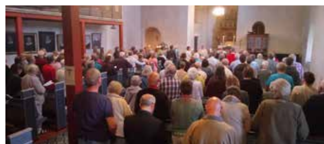
Etter avdukingen var det pilegrimsgudstjeneste i en fullsatt Hoff kirke.