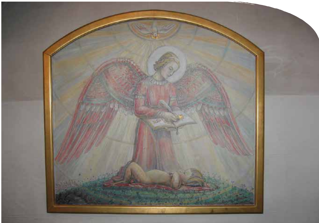
Barnet i Hoff kirke.