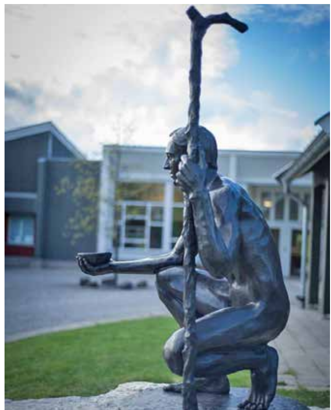
Pilegrimen er nå trygt plassert utenfor Bygdestua.