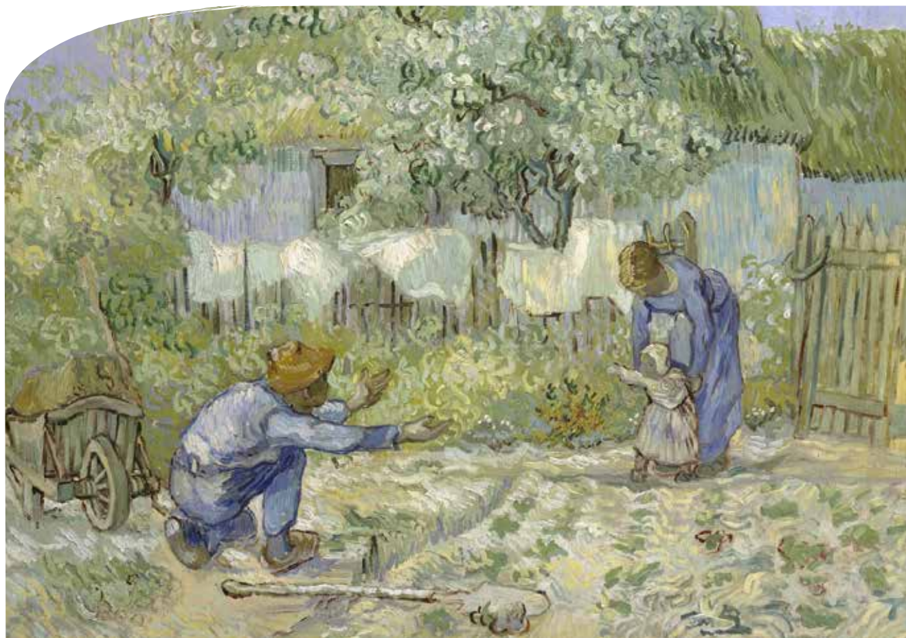
Av Vincent van Gogh 1890 "De første skrittene".