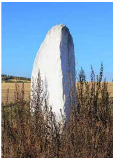
Majersteinen Østre Toten

Ved Ner-Skjefstad kan vi ta ein liten avstikker mot høgre, for å sjå på Majersteinen. Det er ein kultstein frå førkristen tid. Tilsvarande steinar finn vi mange av i Sverige. Majersteinen