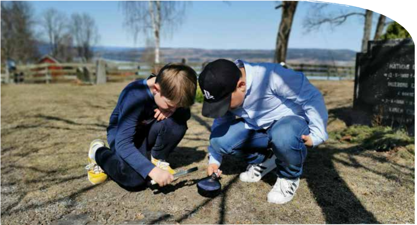
Tårnagenter i Nordlien leter etter fotspor.