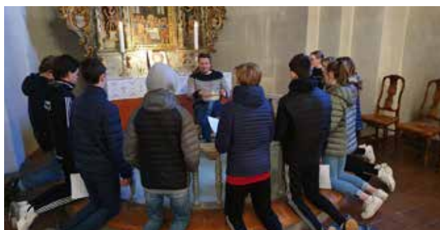
Pilegrimsvandring Hoff 1.

I pilegrimsvandringen gikk konfirmanter pilegrimsleden fra Hoff kirke til Kapp kirke med noen stopp underveis. Her fokuserte vi på lokal kirkehistorie og på historikk om pilegrimsvandring og kristningen av Norge. Konfirmanter fikk utdelt en quiz som de svarte på underveis. Vel nede i Kapp kirke fikk konfirmanter servert varme pølser og saft.