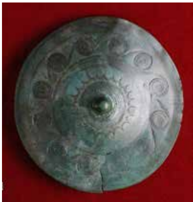
Bronsespenne funne på Evang.

Sjølv om pilegrimsleia så omtrent følgjer den gamle Kjølvegen frå Hadeland og over Toten, tek han mange stader av frå den opprinnelege veglina. Men nå er vi innatt på Kjølvegen.