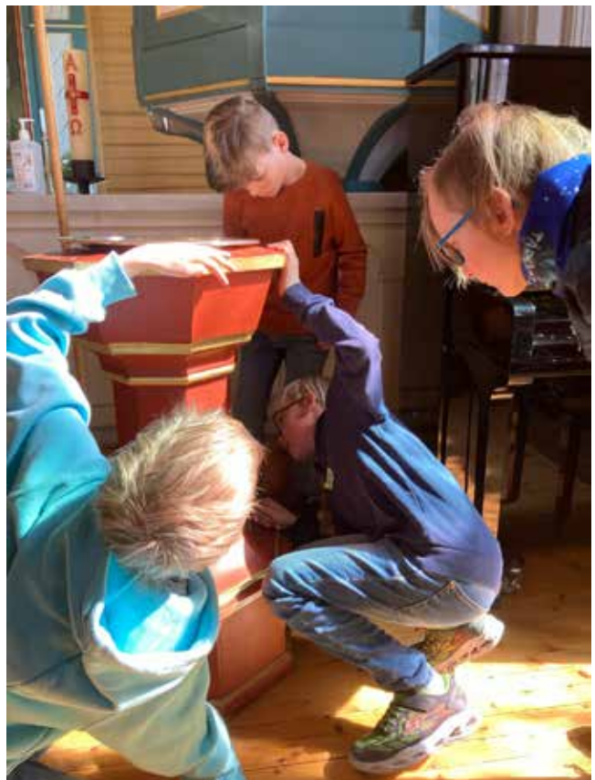
På jakt etter spor.

Tårnagenthelg arrangeres over hele landet og det kan bli så mange som 10.000 aktive tårnagenter pr. år.