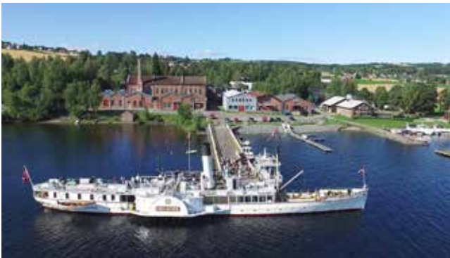
Skibladnerbrygga på Kapp med Skiblander ved kai.

Pilegrimsleia gjennom Østre Toten går nordover, gjennom Nordlia, og vi følgjer den. Like før vi kjem åt grensa mot Gjøvik, ser vi ein diger stein midt på eit jorde. Steinen har gitt namn til garden han ligg på, Steinsli. Dette er ein flyttblokk frå siste istid. Men segna seier at det var gygra på Tjuvåskampen som kasta han etter Hoffskjorkja da kjorkja vart bygd. Etter