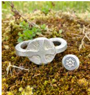
Avstøypningar av pilegrimsmerke og knapp som er funne på Evang

bilde ved siden av ser vi to modellar han har støypt av funn han har gjort. Den eine modellen er avstøyping av eit pilegrimsmerke, eit merke pilegrimmane sette på staven sin. Den andre modellen er avstøyping av ein knapp han har funni.