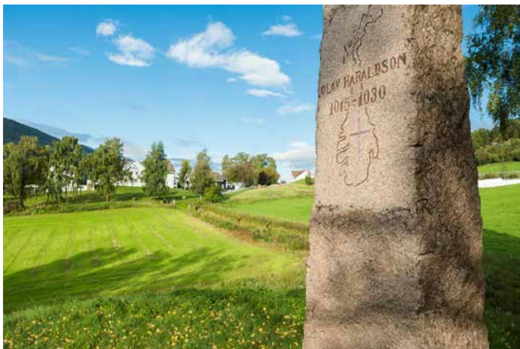
Bilde fra vikingdag på Hundorp.

Utviklingen for samfunnet vårt i de 1000 åra etter kristningen rommer en utrolig historie. Bli med på reisen tilbake i tid, men med nåtidens blikk.