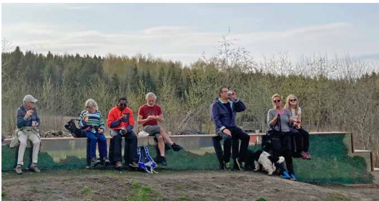
Fra pilegrimsskulpturen "Enmannsstien"

Nå har vi Mjøsa rett nedanfor oss. Innsjøen slynger seg gjennom det frodige mjøslandskapet, frå Lillehammer i nord til Minnesund i sør. På andre sida av fjorden har vi Nes og Helgøya, mellom desse kan vi sjå Hamar. Gjøvik ser vi i nord. Vi