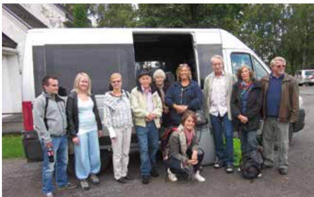
Bildene er fra menighetstur i 2011

Absolutt siste påmeldingsfrist for Romaniatur er 19. september