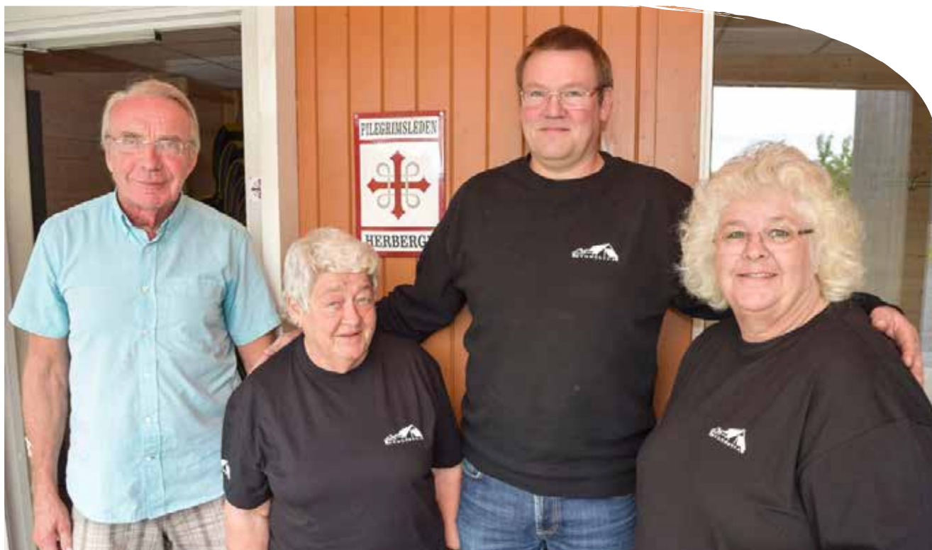
Vertskapet på Pilgrimssenteret i sommer.