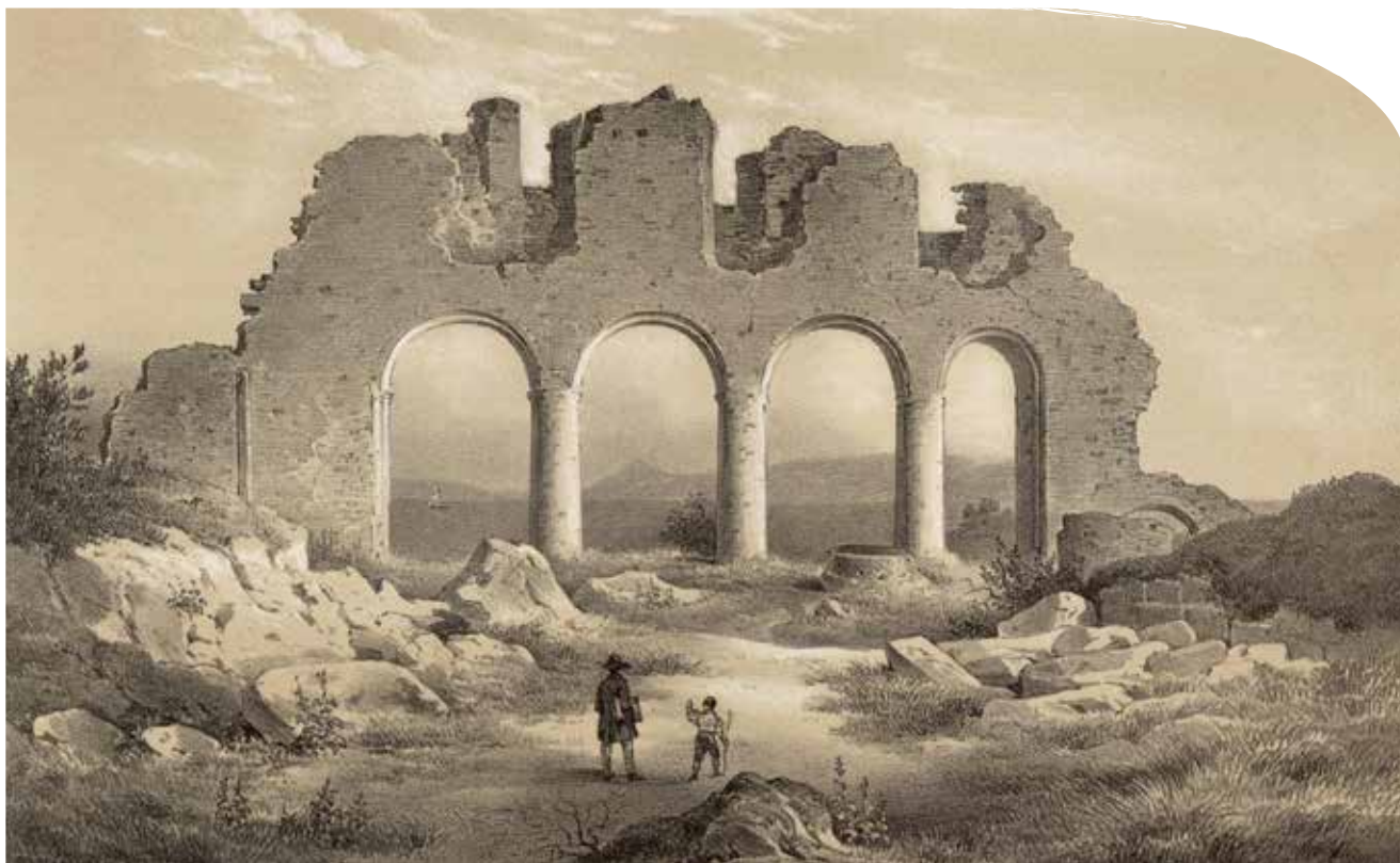
Hammer Ruiner, C. Möller har gjort litografi etter Frich-tegning.