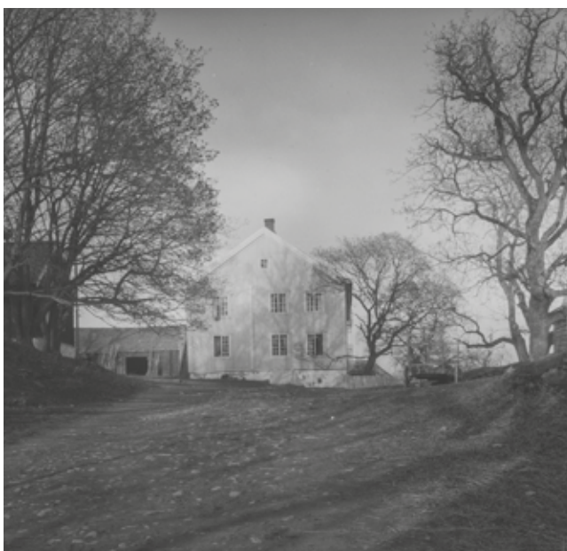
Prestegarden på Toten.

Nå starta kampen for å få godkjent den nye, nynorske sal-