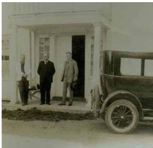
Anders Hovden med flere utanfor prestegarden