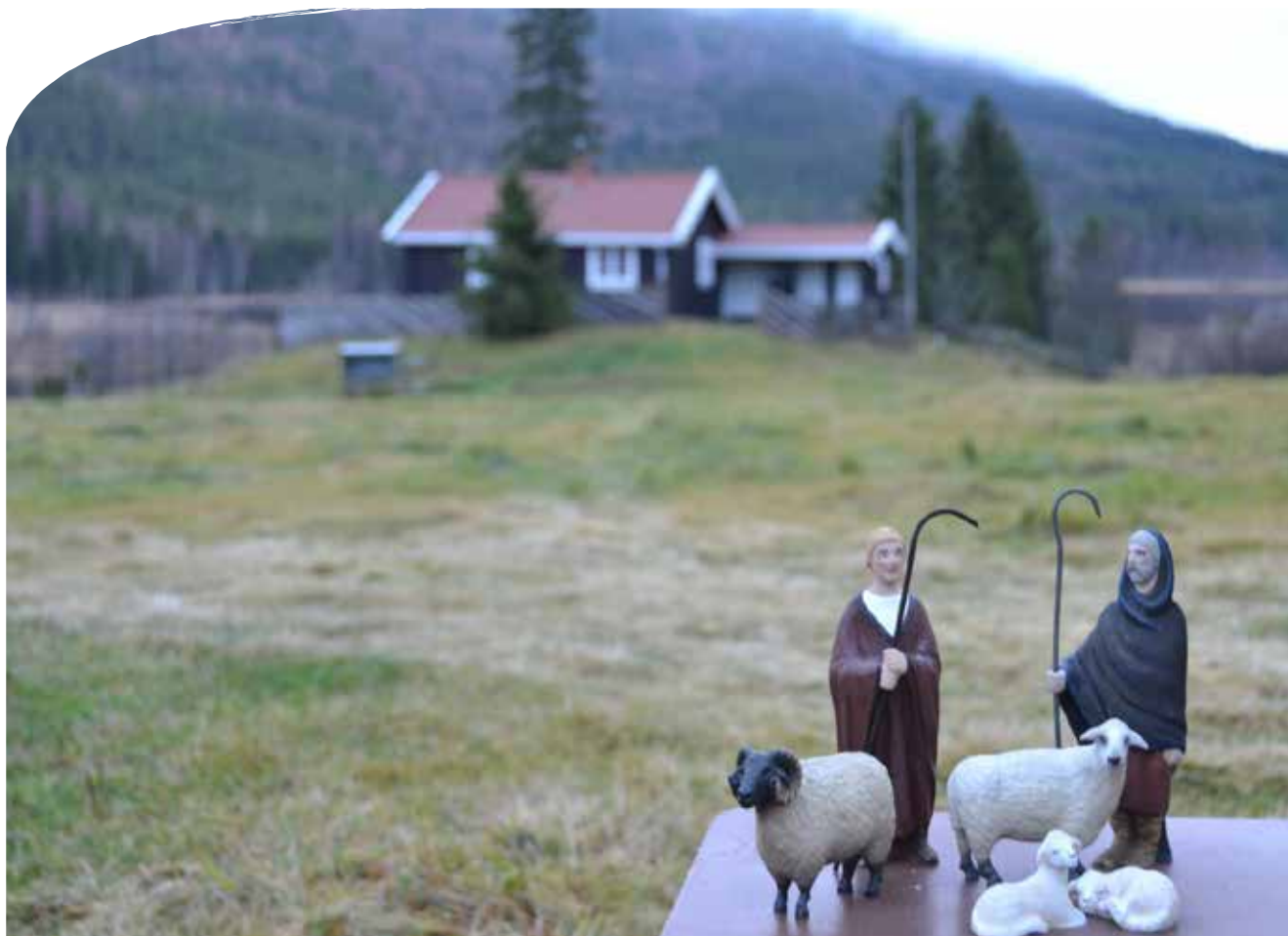
Gjeterne holder vakt over sauene sine med Skjefstadsætra i bakgrunnen.