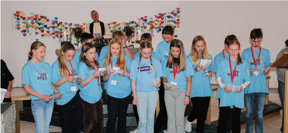
Lys Vaken-gjengen song «Tenn lys» medan det første adventslyset vart tent i Sund.