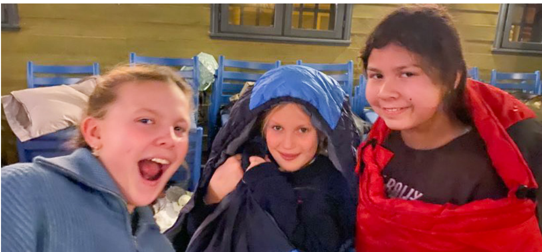
I Blomvåg kyrkje var soveposen god å ha!

Elevane laga òg gule stjerner som dei hengde opp ved utgangsdøra. Seinare på kvelden gjekk dei ut og hadde snøballkrig. Middag fekk dei i løpet av kvelden, lasagne med fruktdessert etterpå.