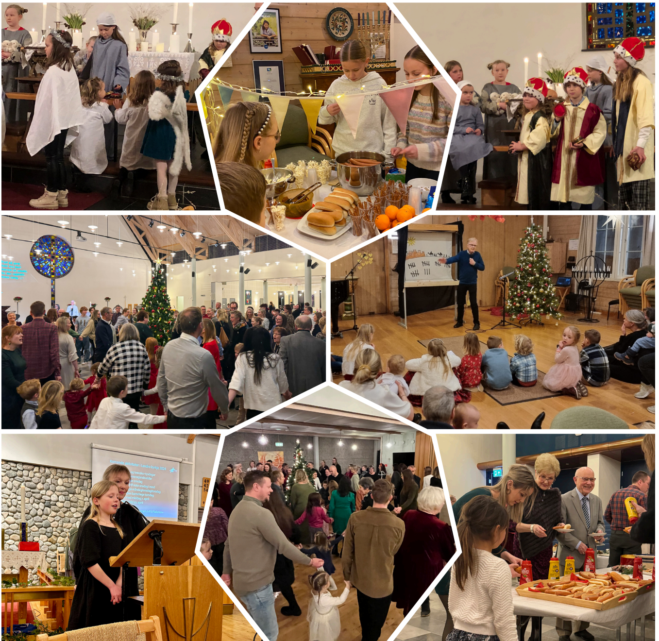
Foto frå Hjelme kyrkje, Fjell kyrkje, Foldnes kyrkje og Landro kyrkje

Både små og store trivdest når kyrkjene var fylt til tradisjonelle juletefestar første helga i januar. God mat, andakt, leikar, juletegang og besøk av dei heilage tre kongar, noko for heile familien!