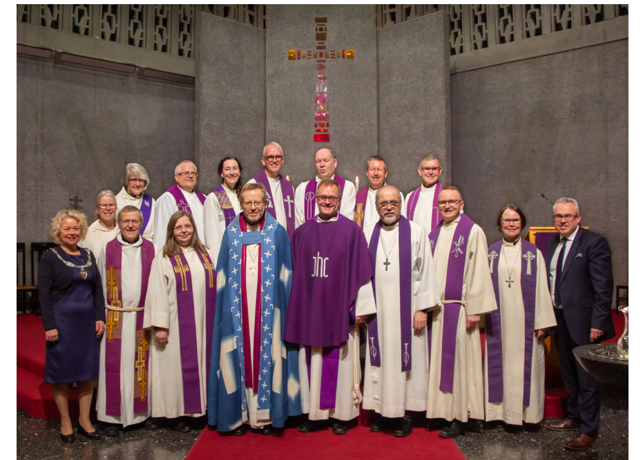
Biskopen, prostiets prestar og diakonar saman med ordførarane frå Askøy og Øygarden.