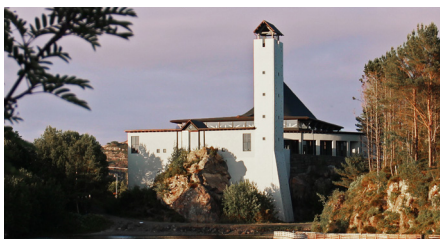
Foldnes kyrkje - byggjeår 2001