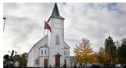
Fjell kyrkje - byggjeår 1874