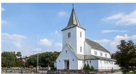
Kausland kyrkje - byggjeår 1881

Det er 8 kyrkjer i Øygarden, inkludert Hjelme gamle kyrkje som ikkje er i dagleg bruk. Kyrkjene er eit av få signalbygg i kommunen. Dei fortel ein historie, samstundes som dei har ei viktig rolle i lokalsamfunnet. Mange har eit nært forhold til si kyrkje.