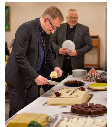
Den nye prostens forsyner seg av kake.