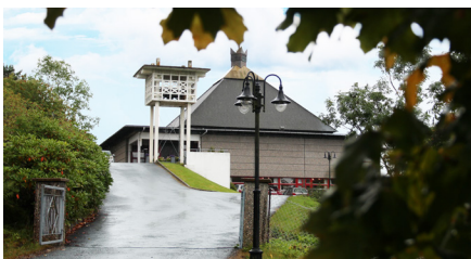
Landro kyrkje - byggjeår 1977