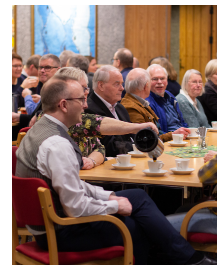
Mange vart med på kyrkjekaffi etterpå.